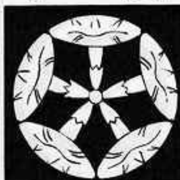
五つ朝顔 ご あさがお