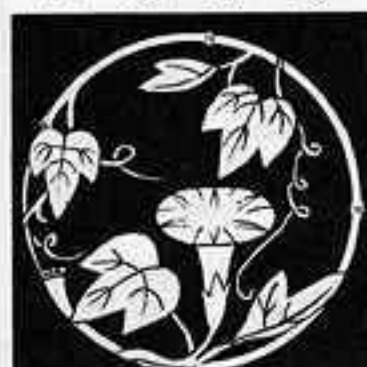
竹丸に朝顔 たけ 丸 に あさがお