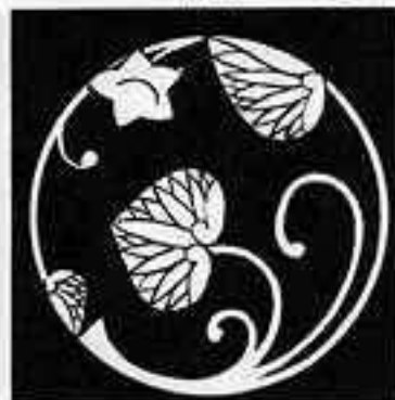
葵の丸 あおい 丸