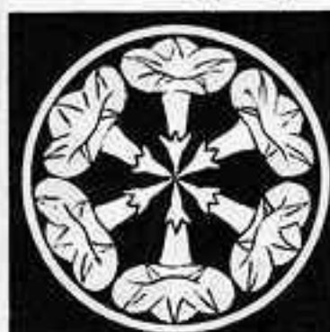
細輪に六つ朝顔 ほろわ 六 あさがお