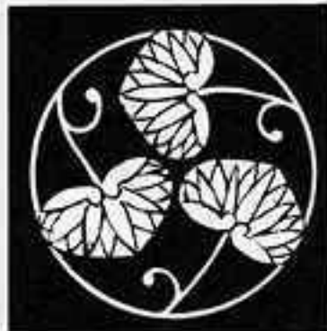
蔓三つ葵の丸 つる さん あおい 丸