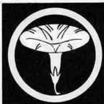
丸に一つ朝顔 まる ひとつ あさがお