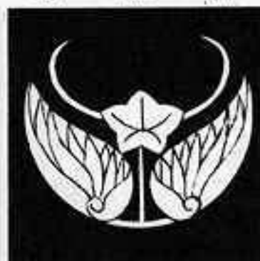
葵蝶 あおい 蝶