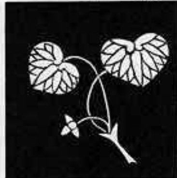
花付き二葉葵 はなつき ふた あおい