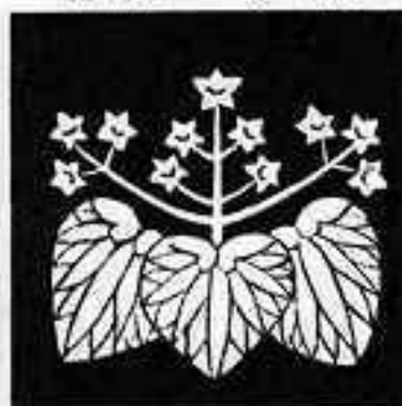
葵桐 あおい 桐