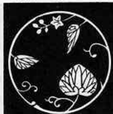
変わり蔓葵の丸 かわり つる あおい 丸