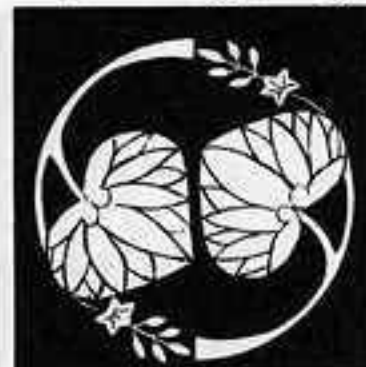
花付き追い葵 はなつき おい あおい