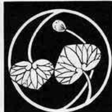
変わり葵の丸 かわり あおい 丸