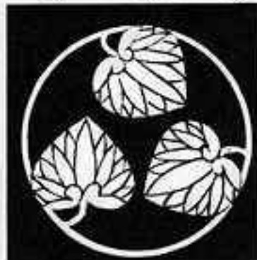
三つ葵の丸 さん あおい 丸