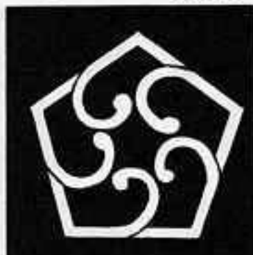
中陰五つ捻じ葵 ちゆういん ご ねじ あおい