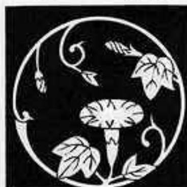
朝顔枝丸 あさがお 枝 丸