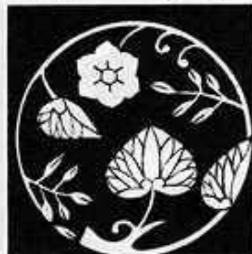
葵草丸 あおい 草 丸