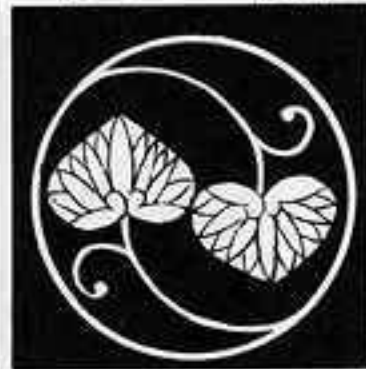
二つ蔓葵の丸 つるふた あおい 丸