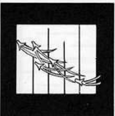
松 風 まつ かぜ