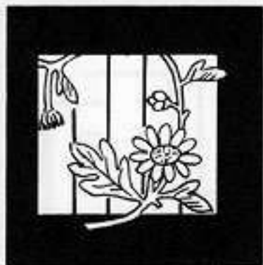
野 分 の ぶん