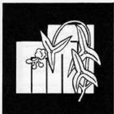
夕 霧 ゆふ きり