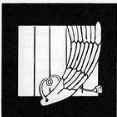
帯 木 おび き