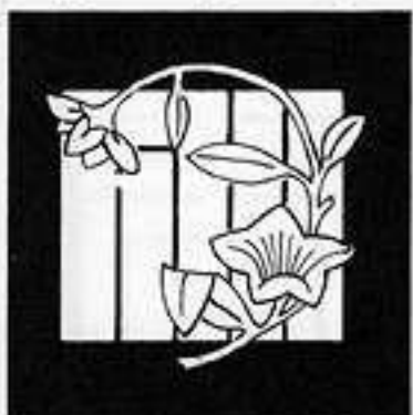
少 女 おと め