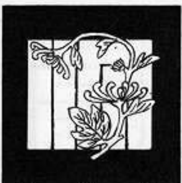
花 の 宴 はな の えん