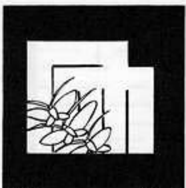
胡 蝶 こ ちょう