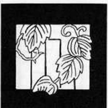
宿 木 やどり き