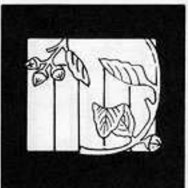
柏 木 かしわ き