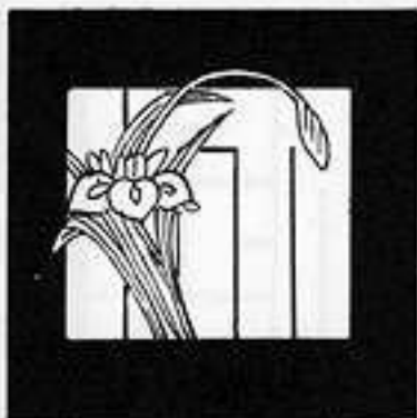
澤 標 みづ ぶたし