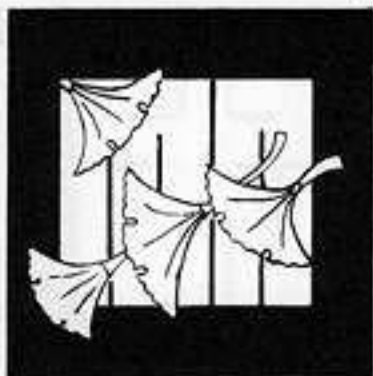
若 紫 わか むらさき