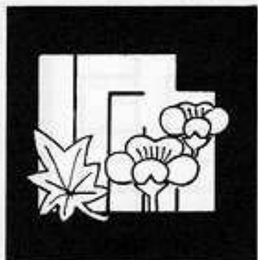
花 散 里 はな ちり さと