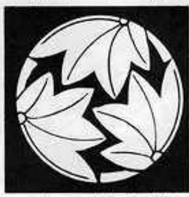
三つ割り楓 みつわり しみじ