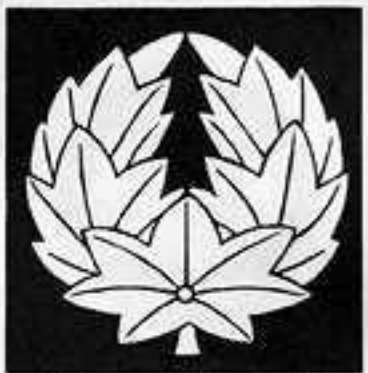
杏 葉 楓 きょう よう しみじ