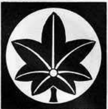
石持ち地抜き楓 いしもち じめ しみじ