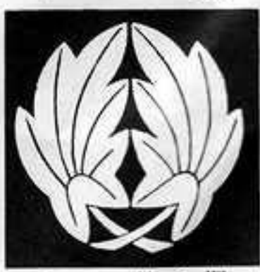
変わり抱き楓 かわりだ しみじ