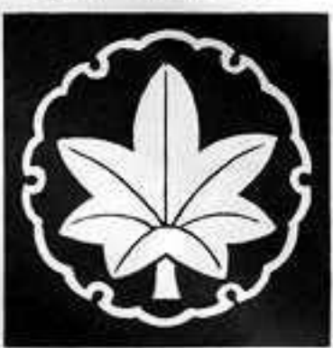
雪輪に楓 ゆきわん しみじ