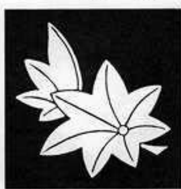
散 り 楓 ち しみじ