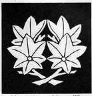
抱 き 枝 楓 だ しみじ