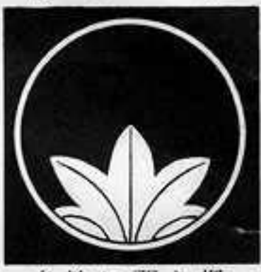
糸輪に覗き楓 いとわ のぞ しみじ