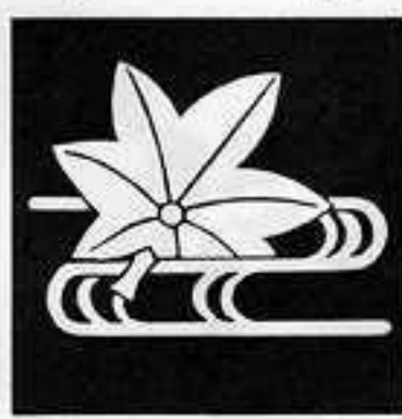
水 に 楓 みづ しみじ