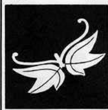
楓 飛 び 蝶 しみじ と しよう