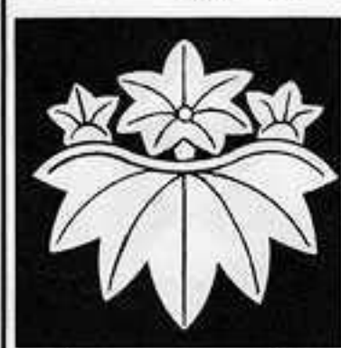
楓 桐 しみじ きり