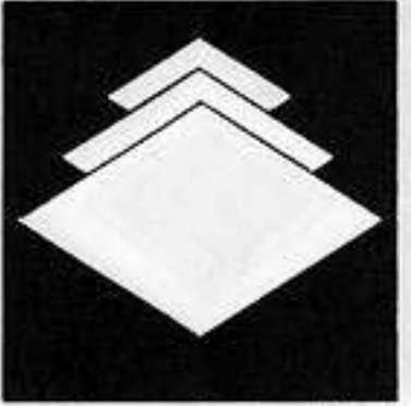
三つ重ね菱 みつかさねびし