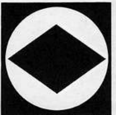
石持ちに菱 こくしにびし