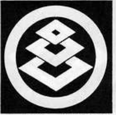
丸に変わり三階菱 まるかわりがいびし