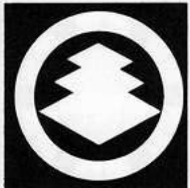
丸に三階菱 まるがいびし