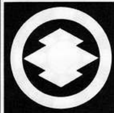
丸に松皮菱 まるまつかわびし