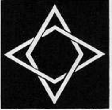
陰組み菱 かげくみびし