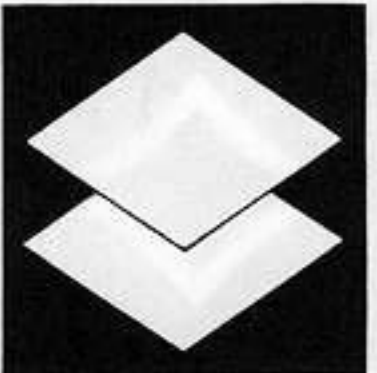
重ね菱 かさねびし