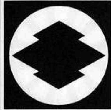
石持ち地抜き松皮菱 こくしじぬきまつかわびし