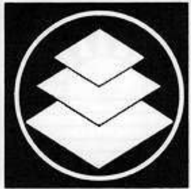
糸輪に重ね三階菱 いとわかさねがいびし