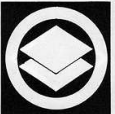
丸に二階菱 まるがいびし