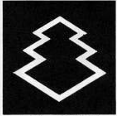
中陰三階菱 ちゆうかげがいびし