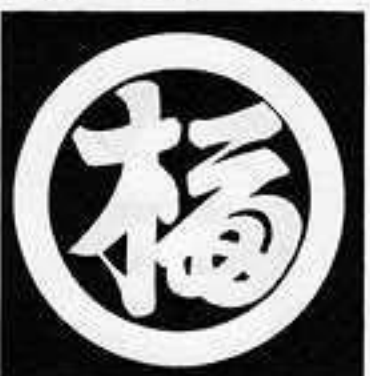
丸に変わり福の字 まる に かわり ふく じ