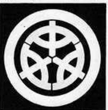
丸に三つ中の字 まる にみつちゅう じ