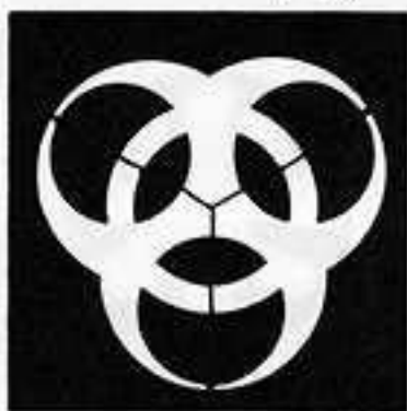
三つ大の字 だい じ