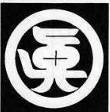
丸に魚の字 まる に うお じ