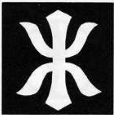
木の字 き じ