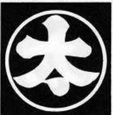
細輪に太の字 ほそりわ にたい じ