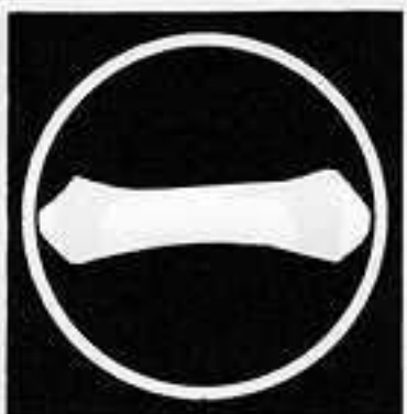
細輪に一の字 ほそりわ に じ