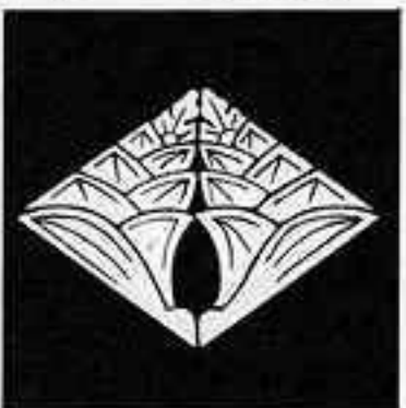
抱き茗荷菱 かきまぎわびし