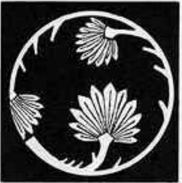
棕櫚枝丸 しゅうろえだまる