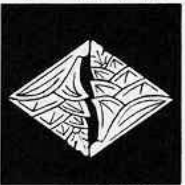
入れ違い茗荷菱 いれがひまぎわびし