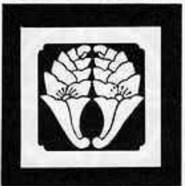
小城花杏葉 おしろはなあんぎ