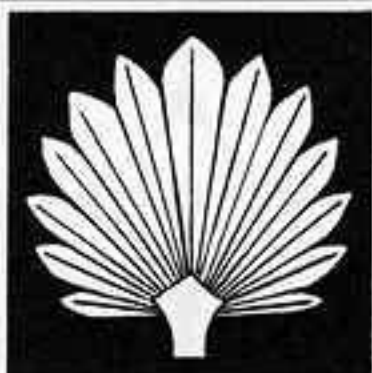
一つ立ち棕櫚 ひとつたちしゅうろ