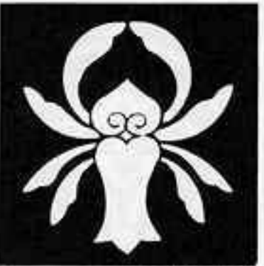
一つ花茗荷 ひとつはなまぎわ