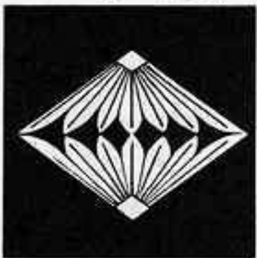
棕櫚菱 しゅうろびし