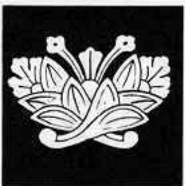
変わり茗荷蝶 かわりまぎわてつ