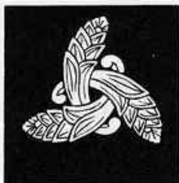
三つ組み茗荷 さんつぐみ ちがひ