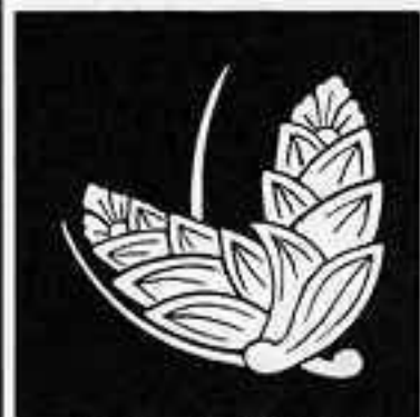
変わり茗荷蝶 かへりちがひ