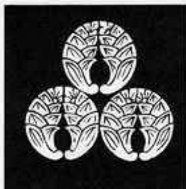
三つ盛り抱き茗荷 さんつせりかきちがひ