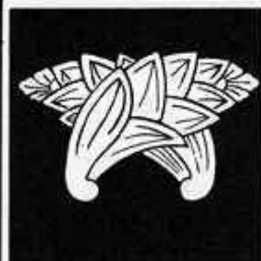
遠い茗荷 ちがひ ちがひ