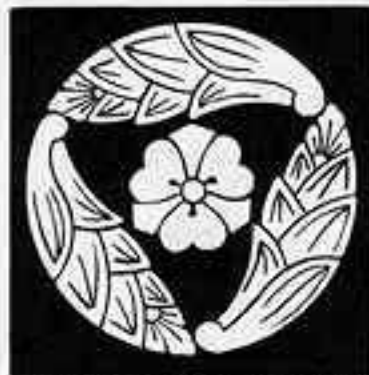
三つ追い茗荷に剣片喰 さんつおいちがひにけんかたばみ