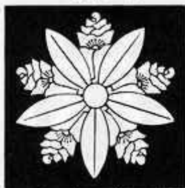
花杏葉車 はなあんぎゃぐるま