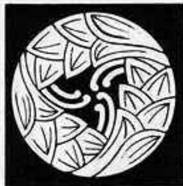
三つ蔓茗荷 さんつづつちがひ