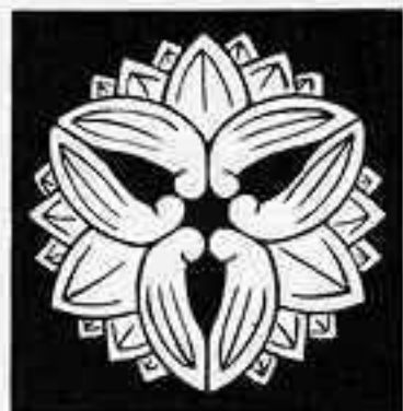
変わり三つ茗荷崩し かへりさんつちがひ