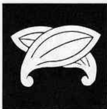
二葉遠い茗荷 ふたばちがひ