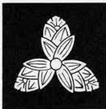
三つ茗荷 さんつちがひ