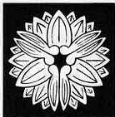
三つ茗荷崩し さんつちがひ