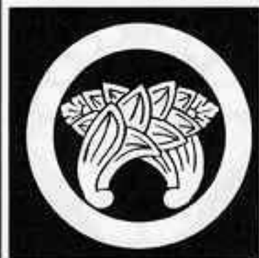
丸に遠い茗荷 まるにちがひ ちがひ