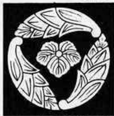
三つ追い茗荷に萬 さんつおいちがひにばん