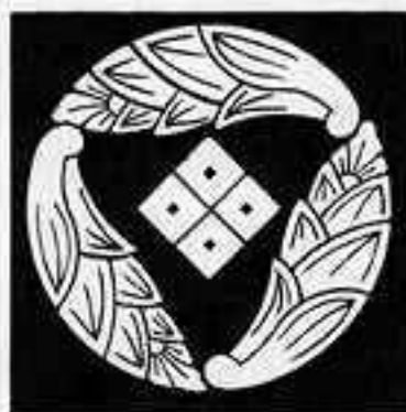
三つ追い茗荷に四つ目 さんつおいちがひによつめ