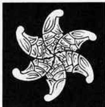
頭合わせ六つ茗荷 かぶあわせむつちがひ