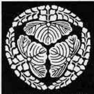
尻合わせ三つ花桐 しりあわせさんみつはなきり