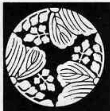
三つ割り五七桐 さんみつわりごしちきり