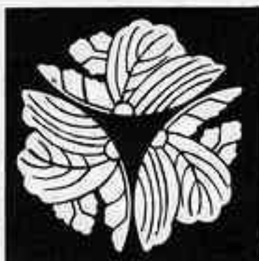
外向き三つ割り桐 けいこうきさんみつわりきり