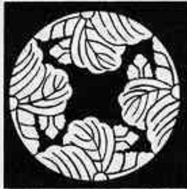
四つ割り桐 よつわりきり