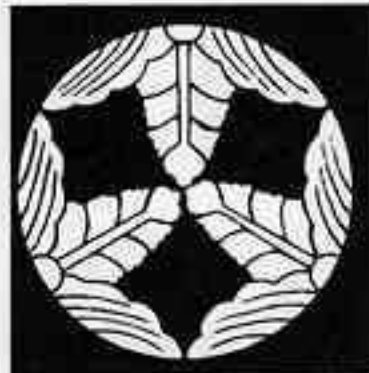
三つ割り花合わせ桐 さんみつわりはなあわせきり