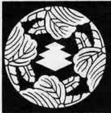
四つ割り桐に三階菱 よつわりきりにさんかいりょう