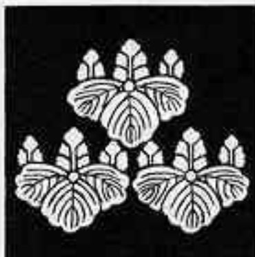
三つ盛り五三桐 さんみつもりごさんきり