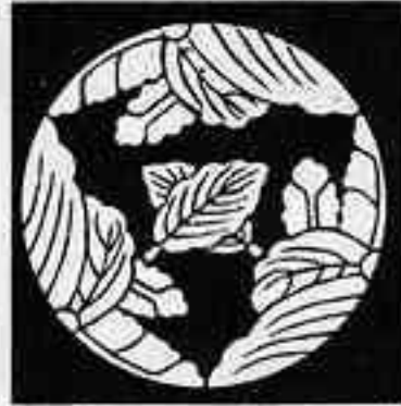
三つ割五三桐に違い柏 さんみつわりごさんきりにちがひかしら