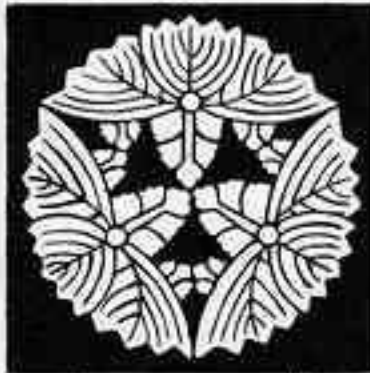
頭合わせ三つ鬼桐 かしんあさんみつおにきり