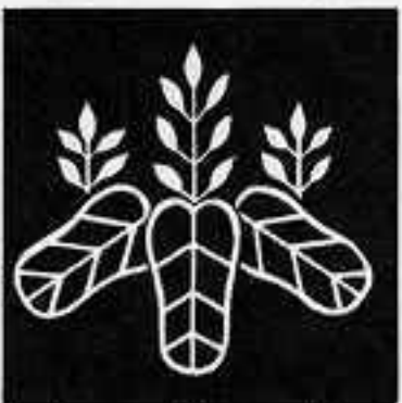
太閤桐 たかうきり