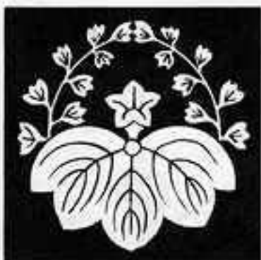
変わり桐崩し かわりきりくず