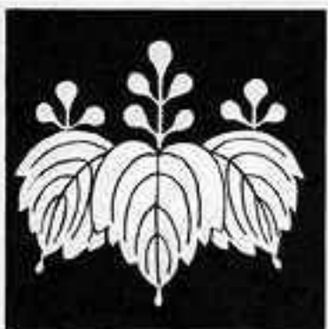
飛翔桐 としょうきり