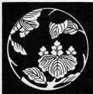
二つ桐枝丸 ふたつきりえだまる