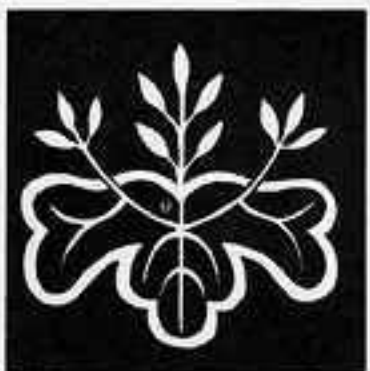
小判桐 こばんきり