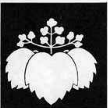
三井桐 さんせいきり