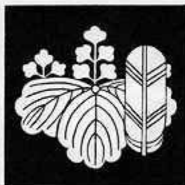
五三桐に鷹の羽 ごさんきりたかのは