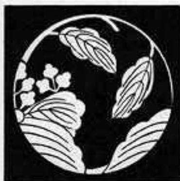
三葉桐枝丸 さんえきりえだまる