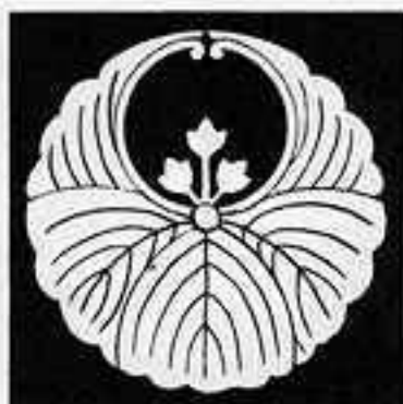
浮線桐 うせんきり