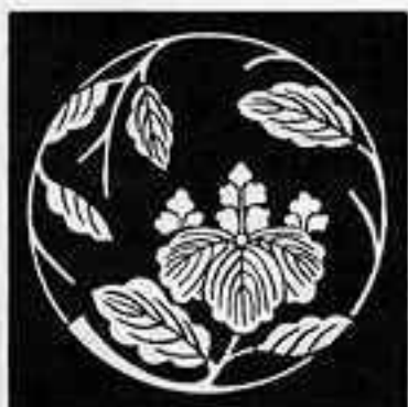
桐枝丸 きりえだまる