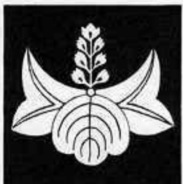
変わり桐 かわりきり