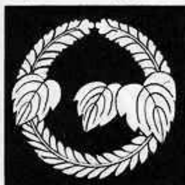
花桐崩しの丸 はなきりくずまる