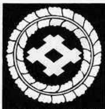
藤輪に井桁 ふじのわに いげた