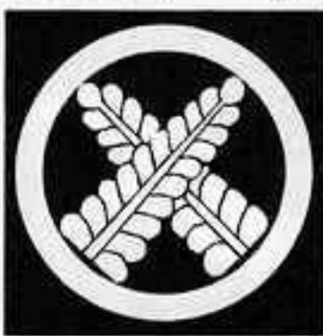
丸に違い藤の花 まるにちがひふじのほな