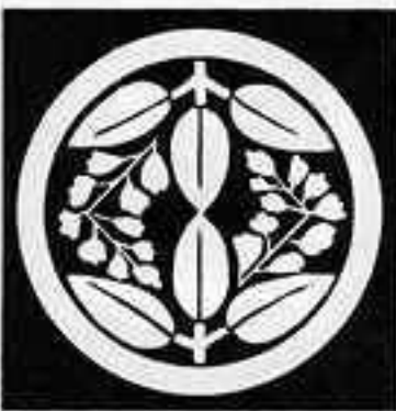
中輪に変わり向かい藤 ちゅうりんかわりむかいふじ