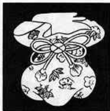
宝袋 たからぶくろ