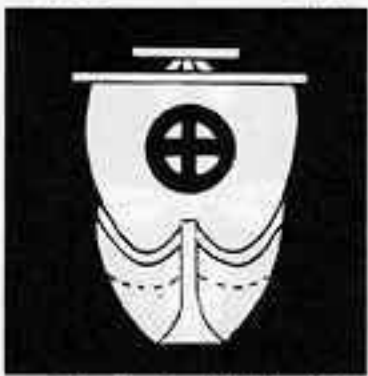
真向き帆掛船 まむきほかけふね