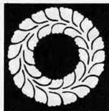
軸付き藤輪 じくつきふじのわ