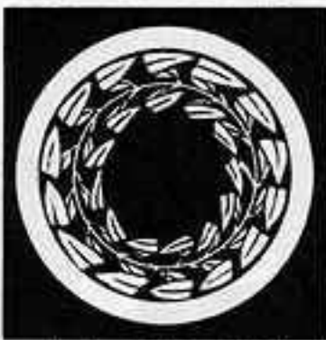
中輪に藤の葉丸 ちゅうりんふじのえまる