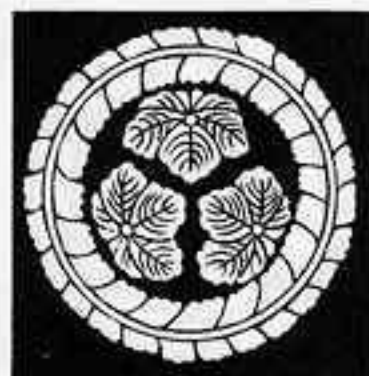
藤輪に尻合わせ三つ葛 ふじのわにしりあわせみつづた