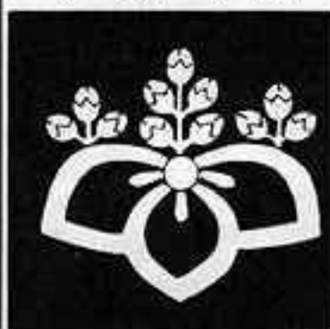
中陰桔梗桐 なかよくききょうとう