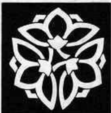
中陰三つ横見桔梗 なかよくみつひろめ ききょう