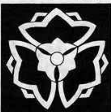
中陰三つ寄せ桔梗 なかよくみつよせ ききょう