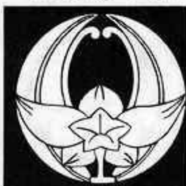
浮線桔梗 うわぜん ききょう