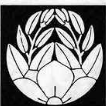
変わり杏葉桔梗 かわりあんじききょう