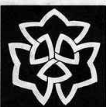
三つ組み桔梗 みつぐみ ききょう