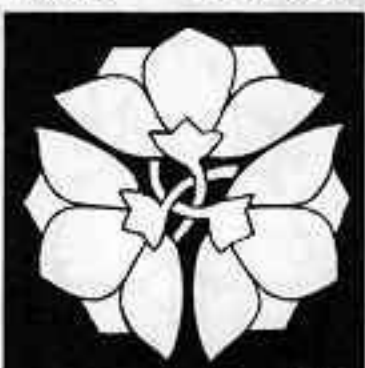
軸違い三つ横見桔梗 つみだじみつひろめ ききょう