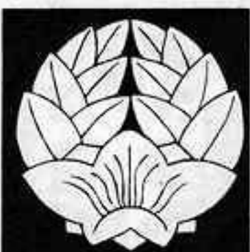
杏葉桔梗 あんじ ききょう