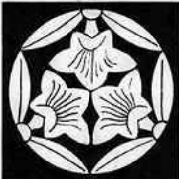
三つ割り三つ葉花桔梗 みつわりみつばな ききょう