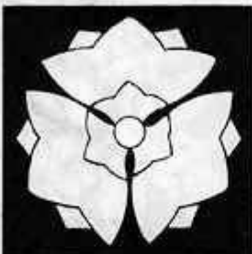
三つ寄せ桔梗 みつよせ ききょう