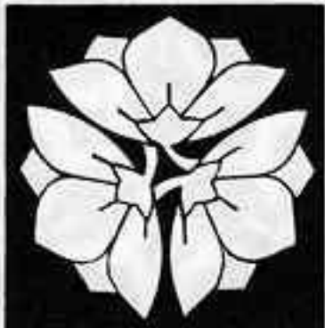
三つ横見桔梗 みつひろめ ききょう