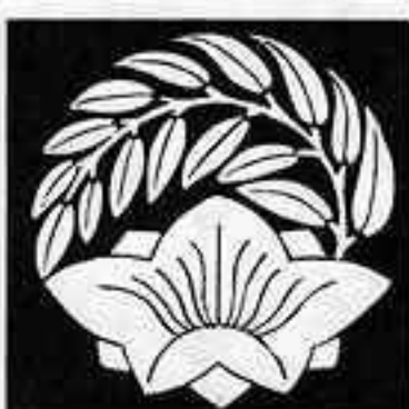
葉付き桔梗の丸 はつきききょうのまる