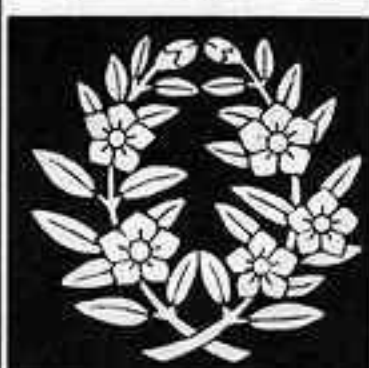
違い枝桔梗 ちがいえだ ききょう