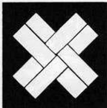
四つ組み違い木 よつぐみいたがいき