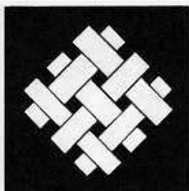
九つ組み木 ゆうつぐみき