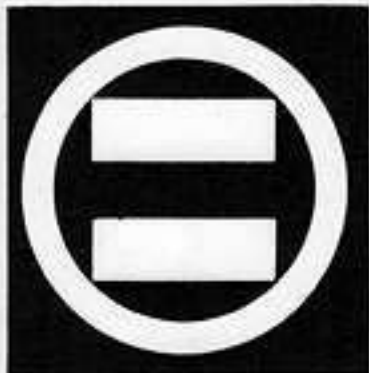
丸に三つ割り二つ木 まるにみつわりふつき