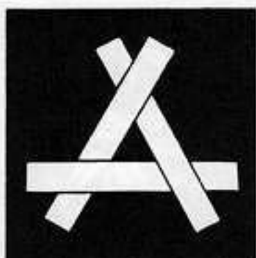
三つ組み木 みつぐみき