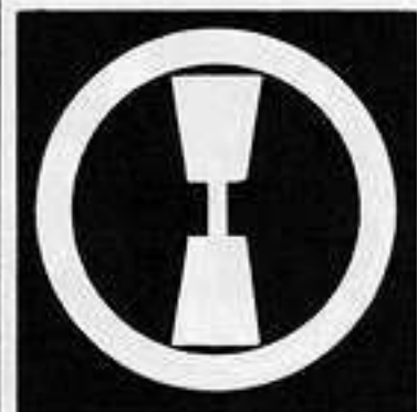
丸に一つ杵 まるにひとつき