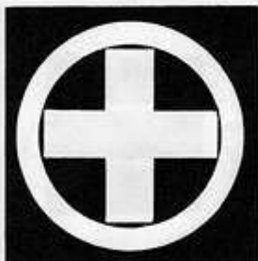
丸に十の字木 まるにじゅうのじき