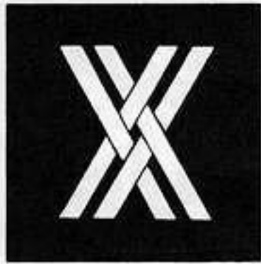
組み違い木 ぐみいたがいき