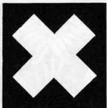
木い違 きいたがい