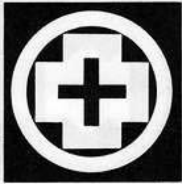
丸に中陰十の木 まるにちゅういんじゅうのき