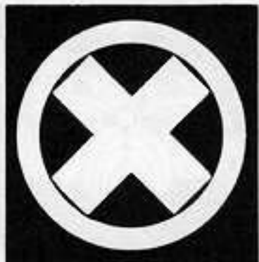
丸に木い違 まるにきいたがい