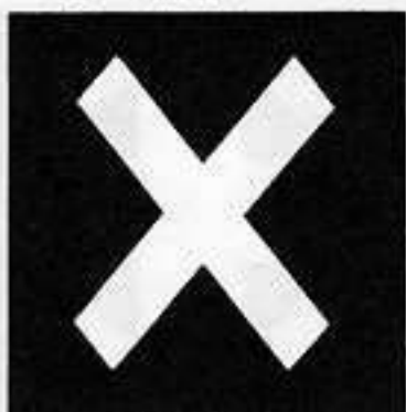
丹羽違い木 にわいたがいき