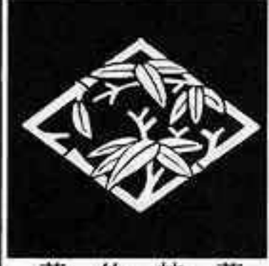
若竹枝菱 わか たけ えだ びし