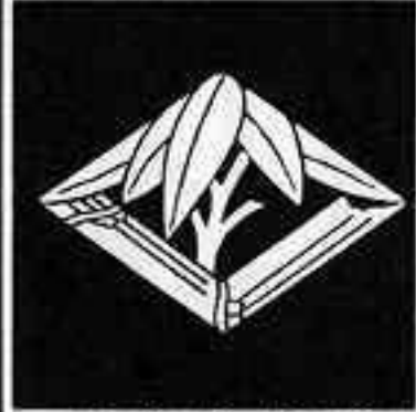
五枚竹笹菱 まい たけ ささ びし