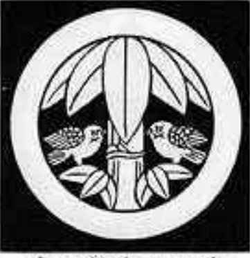
丸に竹向かい雀 まる たけ し すずめ