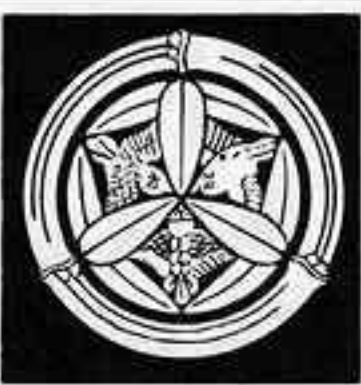
竹輪に九枚笹に雀 たけ かり まい ざさ すずめ