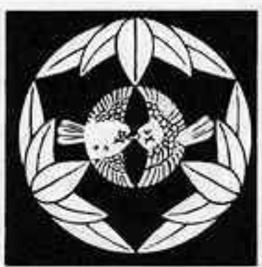
十五枚笹に向かい雀 まい ざさ し すずめ