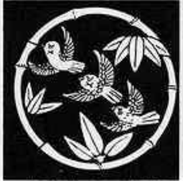
細竹丸に三羽雀 ほそたけ まる ぼすずめ