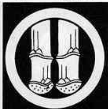
竹 林 竹 たけ ばやし たけ