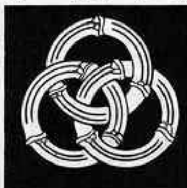
三つ竹輪違 みつ たけわ ちが