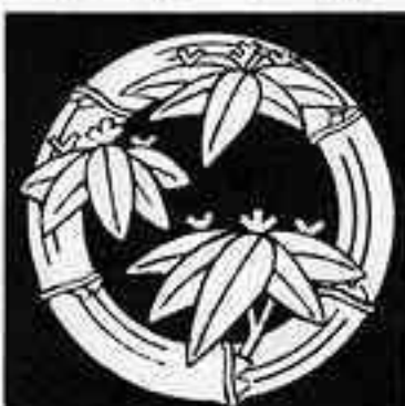
篠笹竹の丸 しのささたけのまる