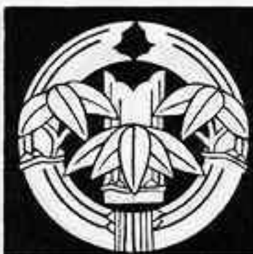
抱き竹に切り竹 かき たけにきりたけ