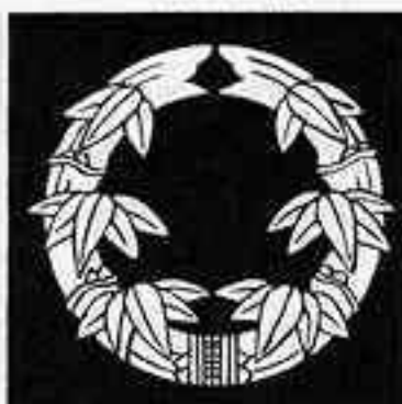
抱き竹丸 かき たけまる