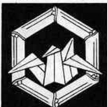
竹亀甲に折り鶴 たけかめこうにおりつる