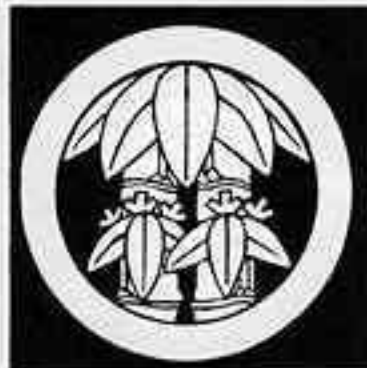
丸に二本竹笹 まる ほんにけ ささ