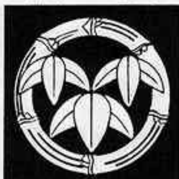
竹輪に変わり三つ盛り笹 たけわにかみみつもりささ