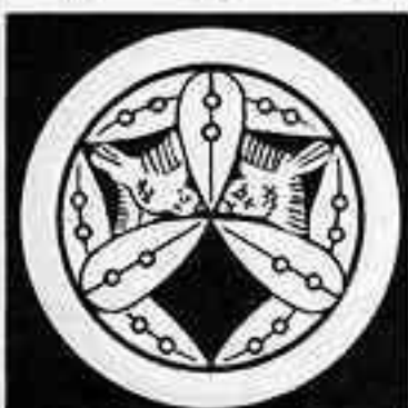
山 口 笹 やま ぐち ささ