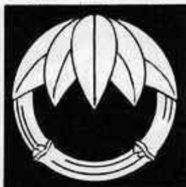
五枚笹竹の丸 ごまいささたけのまる