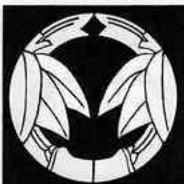
割り十枚笹 わりじゅうまいささ