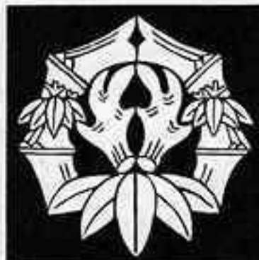
変わり竹丸に抱き角 か たけまる だ づの