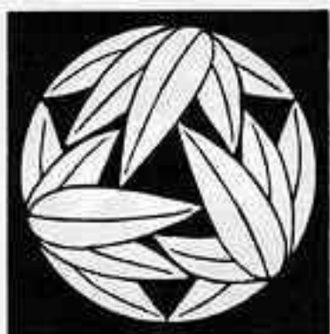
三つ追い十五枚笹