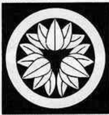
丸に頭合わせ十五枚笹