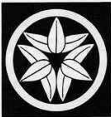
中輪に頭合わせ九枚笹