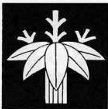
変わり根笹 かわりねささ