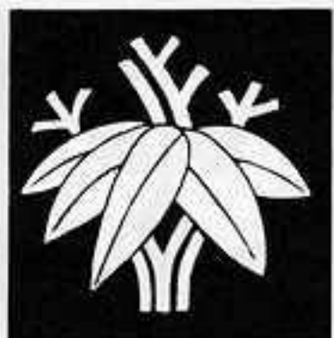
根 笹 ね ささ