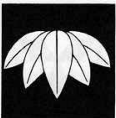
五 枚 笹 ごまいささ