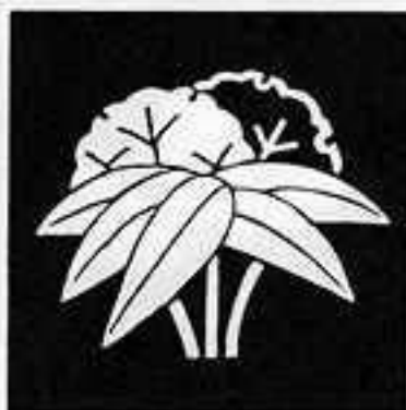
陰陽雪持ち根笹 いんようしゆもちねささ