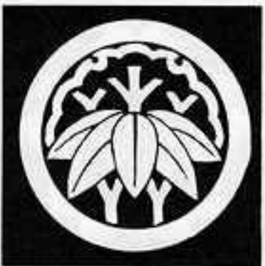
丸に陰雪持ち根笹 まるにいんゆきもちねささ