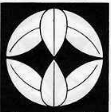
六 枚 笹 むまいささ