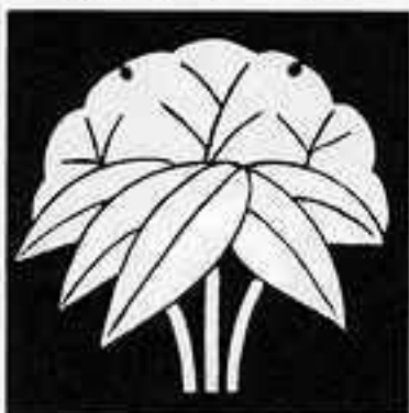
雪持ち根笹 ゆきもちねささ