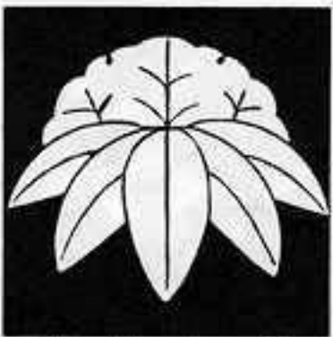
雪持ち笹 ゆきもちささ