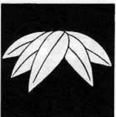
変わり五枚笹 かわりごまいささ