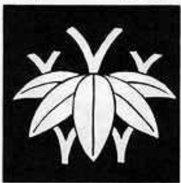
股付き変わり根笹 またつきかわりねささ