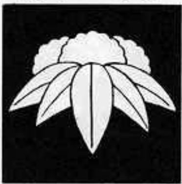
変わり雪持ち笹 かわりゆきもちささ