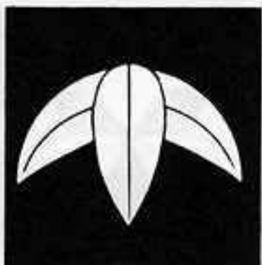
三 枚 笹 さんまいささ