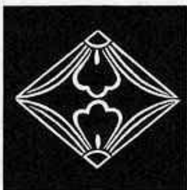
陰向かい藤崩し菱 くろ ぶし びし