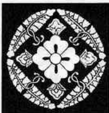
東六条藤 とう ぶし びし