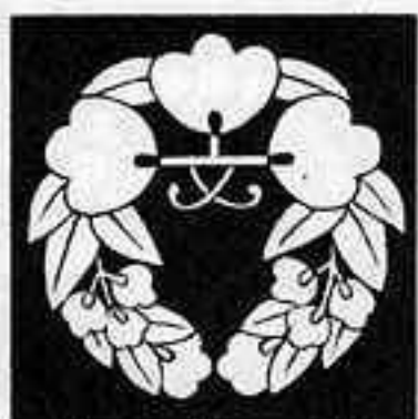
装飾藤 ぶし びし