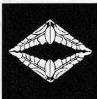
向かい藤菱 シロ ぶし びし