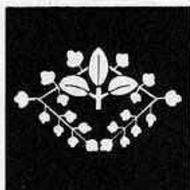
下がり散藤菱 シロ ぼり ぶし びし