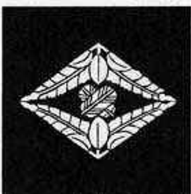
向かい藤菱に違い鷹 ぶし びし