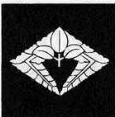
下がり藤菱 くだり ぶし びし