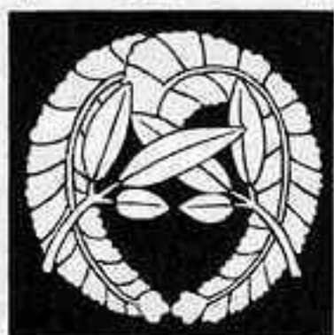
軸違い藤 くろ ぶし びし