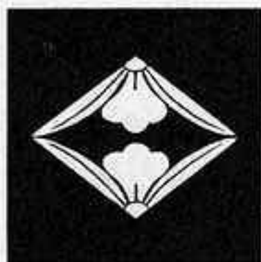
向かい藤崩し菱 シロ ぶし びし