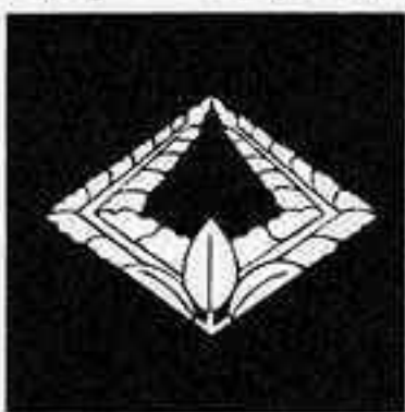
上がり藤菱 あがり ぶし びし