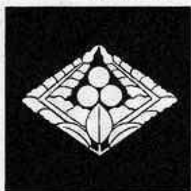
上がり藤菱に三つ星 あがり ぶし びし