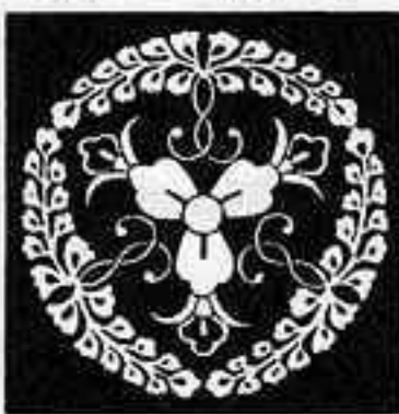
九条家六つ藤 くじゅう ぶし びし