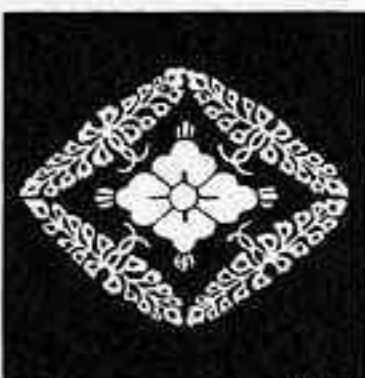
八つ藤菱 やっ ぶし びし