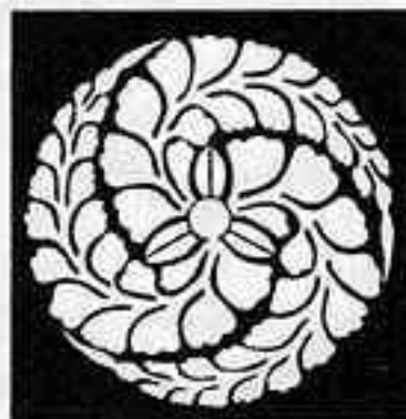
軸付き右三つ藤巴 くろ ぶし びし