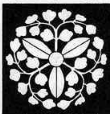
三つ葉散藤の丸 ぶし びし