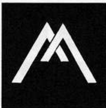
入り山形 いり やま がた