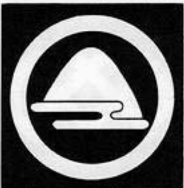
丸に遠山 まる に とお やま