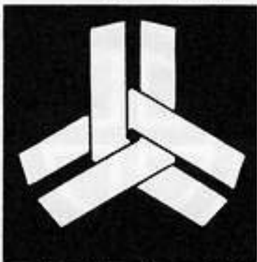
三つ組み合い山形 みつ 組みあひ やま がた