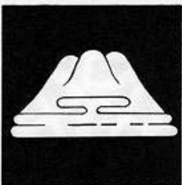
変わり富士霞 か わり ふじ けり