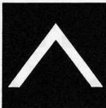
山形 やま がた