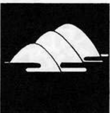
三つ遠山 みつ とお やま