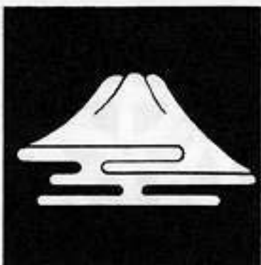
富士山形 ふじさん がた