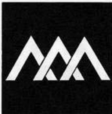
三つ違い山形 みつ ちがひ やま がた