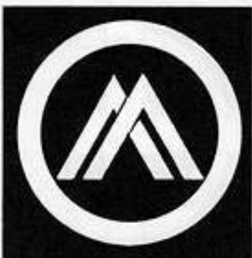
丸に違い山形 まる に ちがひ やま がた