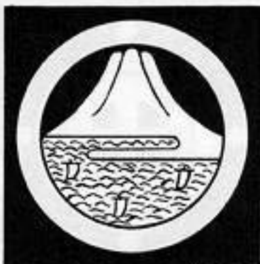
丸に富士山に帆掛舟 まる に ふじさん に ほかけぶね