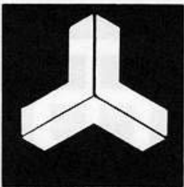
頭合わせ三つ山形 かしらあひ 三つ やま がた