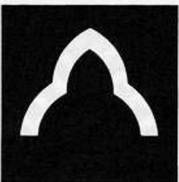
花山形 はな やま がた