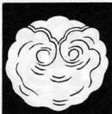
一つ雲 いち つ の くも