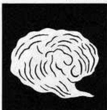
降り雲 くだり の くも