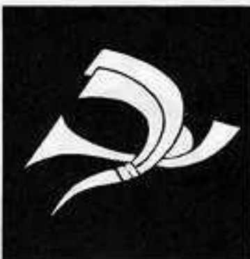
熨斗鶴 の し づる