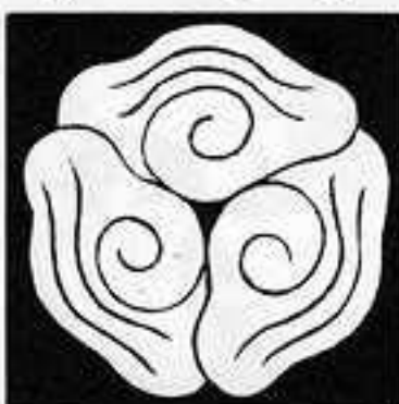
三つ重ね雲 みつ ねがひ の くも