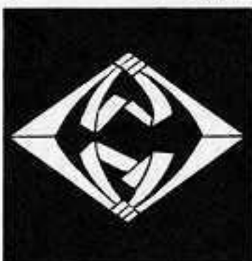
向かい熨斗菱 むかい の し ちょう ひし