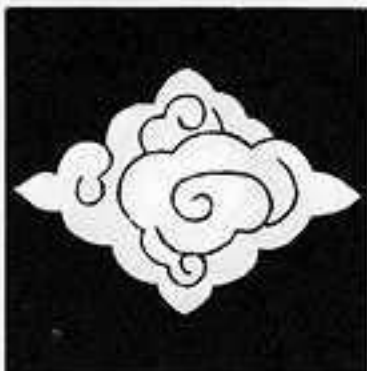
雲菱 くも がた の ひし