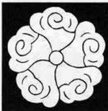
五つ雲 いつ つ の くも