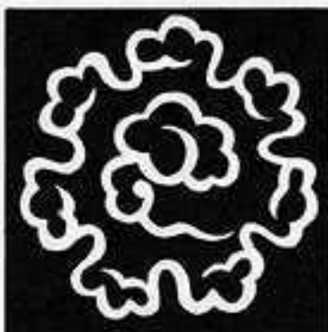
東寺雲 ひがし じら の くも