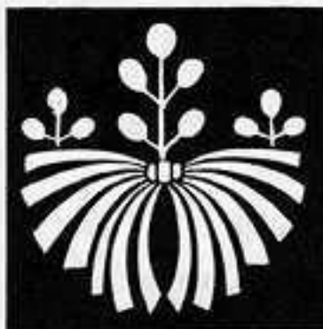
熨斗桐 の し ぎり