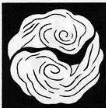
二つ雲巴 ふた つ の くも ども