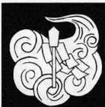
雲に御幣 くも に ごひ