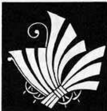
熨斗蝶 の し ちょう