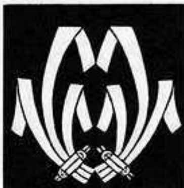
向かい飾熨斗 むかい ぶし の し ちょう