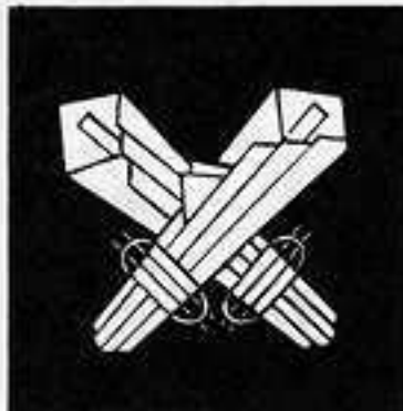
熨斗折り違い の し 折り ちがひ