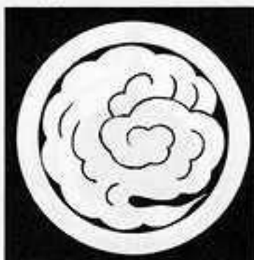
丸に雲 まる に の くも