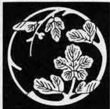
梶の葉枝丸 かじ は えだ まる