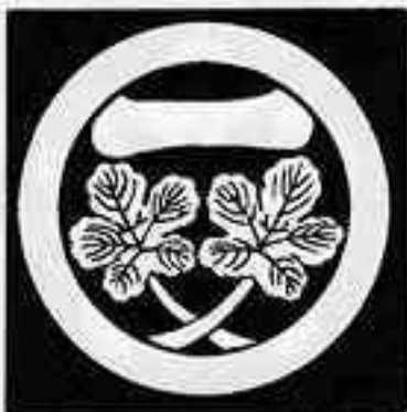
丸に一の字違い梶の葉 まる じちが かじ は