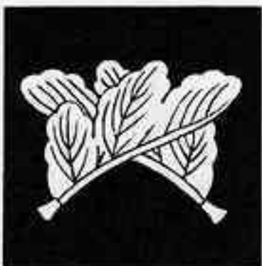
割り違い梶の葉 わ ちが かじ は