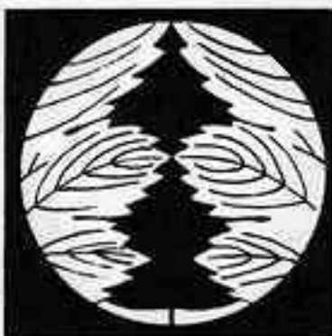
割り鬼梶の葉 わ おに かじ は