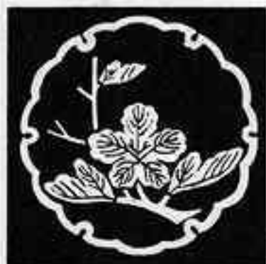
雪輪に枝梶 ゆきわ えだ かじ