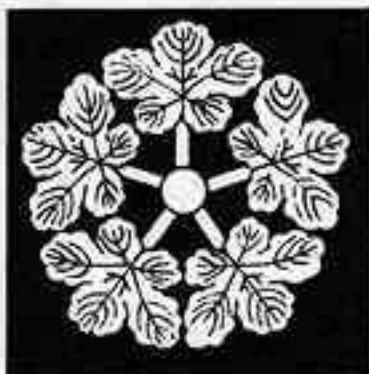
五つ梶の葉車 かじ はぐるま