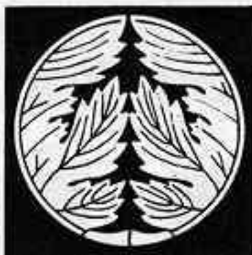
割り平戸梶 わ びら と かじ