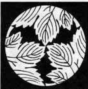
三つ割り鬼梶の葉 お 三つ おに かじ は