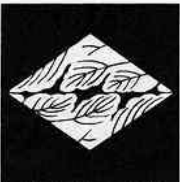
割り梶の葉菱 わ かじ は びし