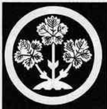
諏訪梶の葉 す ぶ かじ は