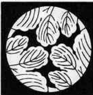
三つ割り梶の葉 お 三つ かじ は