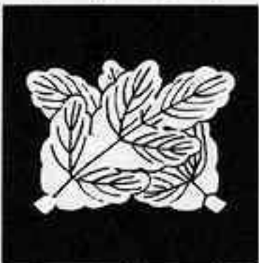
違い梶の葉 ちが かじ は