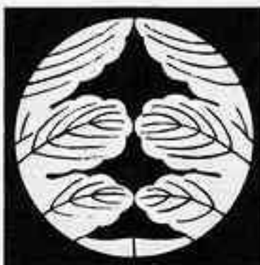
割り梶の葉 わ かじ は