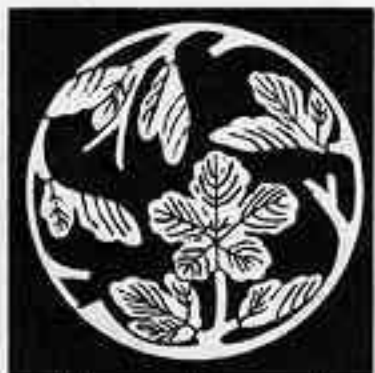
梶枝丸 かじ えだ まる