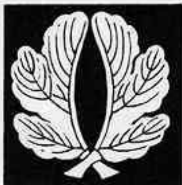
外割り梶の葉 そとわ かじ は