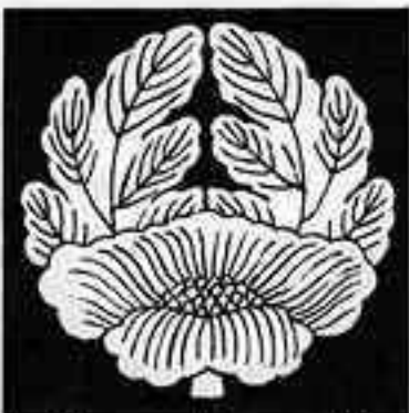
杏葉梶 あんざい かじ