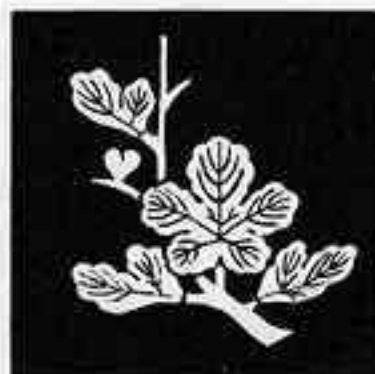
枝梶の葉 えだ かじ は