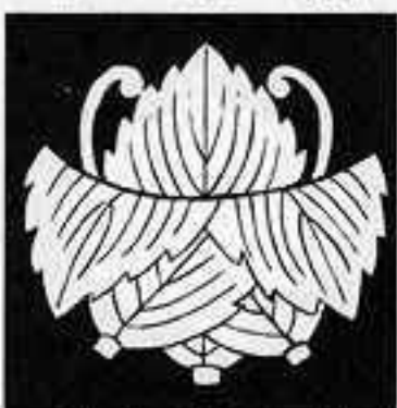
三枚 折れ 柏 さんまい かしわ