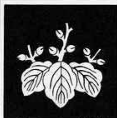
姿わり 柏桐 かしわ ぎり