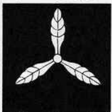
細 芋 柏 ほそ いも かしわ