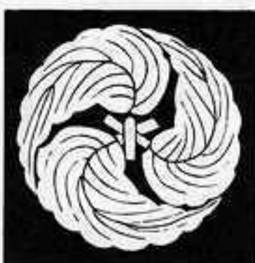
軸 違い 三つ 柏 巴 じくちがひ かしわ ともえ