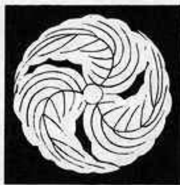
三つ 柏 巴 みつ かしわ ともえ