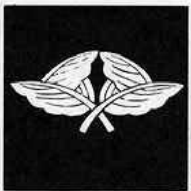
違い 片 折れ 柏 ちがひ かしわ