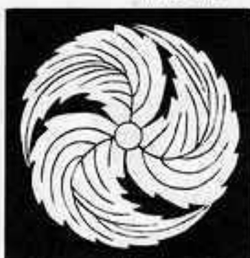
鬼 柏 巴 おに かしわ ともえ