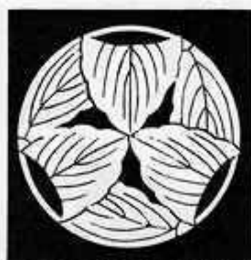
三つ 折れ 枝 柏 みつ かしわ