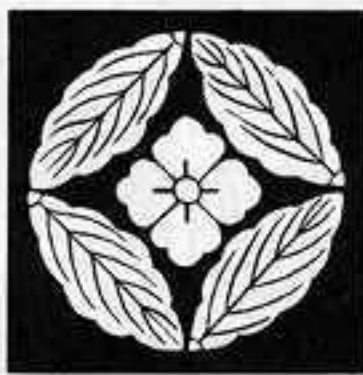
柏七宝に 花角 かしわしちほう ぼんかく