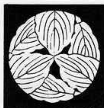
三つ 追い 折れ 柏 みつ おい かしわ