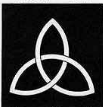
結 び 柏 むす かしわ