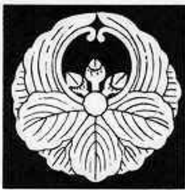
浮 線 柏 うせん かしわ