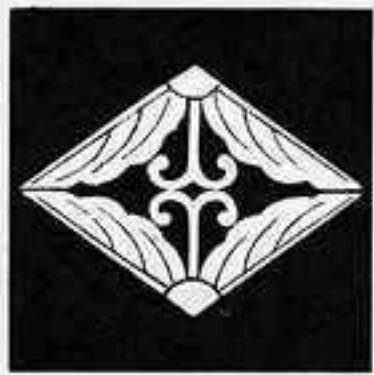
割り 蔓 柏 菱 わり つま かしわ びし