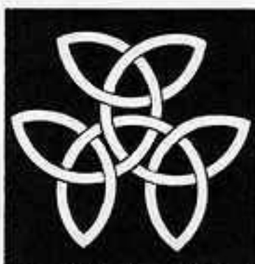
三つ 持ち 合い 結び 柏 みつ もちあひ むす かしわ