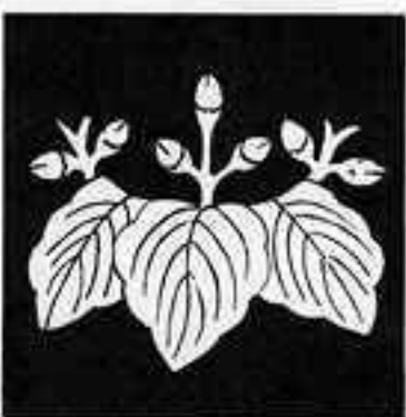
柏 桐 かしわ ぎり