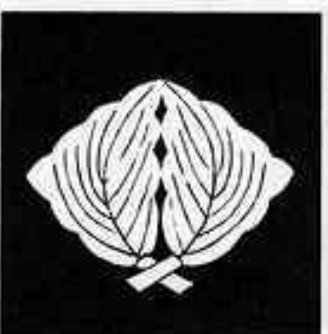
抱き柏菱 だ かしれ びし