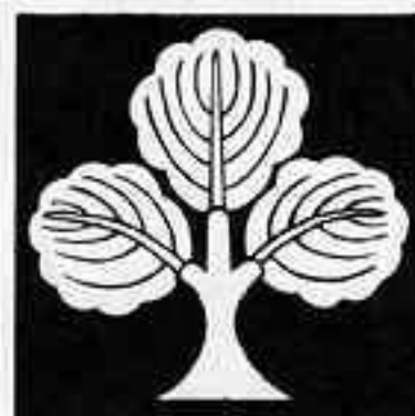
変わり三つ葉柏 か ばかしれ