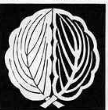
陰陽抱き柏 いんよう だ かしれ