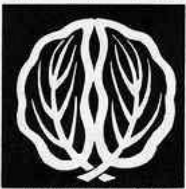
光琳中陰抱き柏 こうりんちゆういん だ かしれ