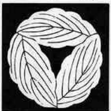
三つ追い重ね柏 お かしれ