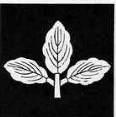
三つ葉柏 ほ かしれ