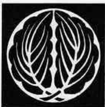
石持ち地抜き抱き柏 いしもち じぬき だ かしれ