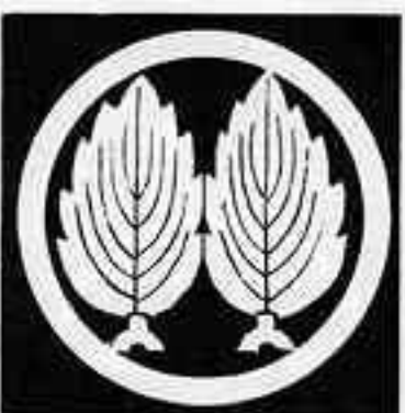
丸に並び鬼柏 まるに なら おに かしれ