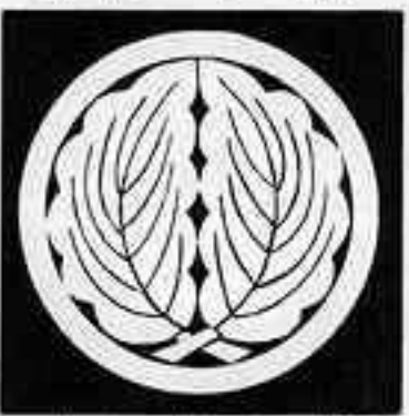
丸に抱き柏 まるに だ かしれ