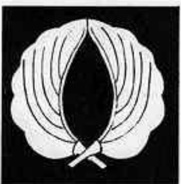
外割り抱き柏 そとわり だ かしれ