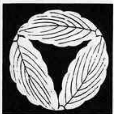
三つ追い柏 お かしれ