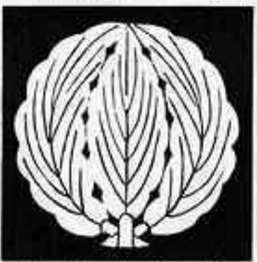
三枚抱き柏 まい だ かしれ