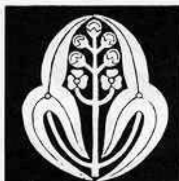
長 洲 沢 瀉 ちやう しゅう せき ぞう