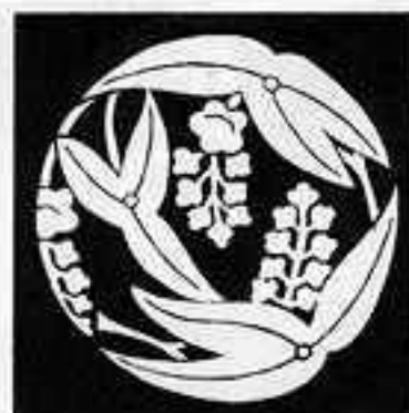
沢 瀉 の 丸 せき ぞう の まる