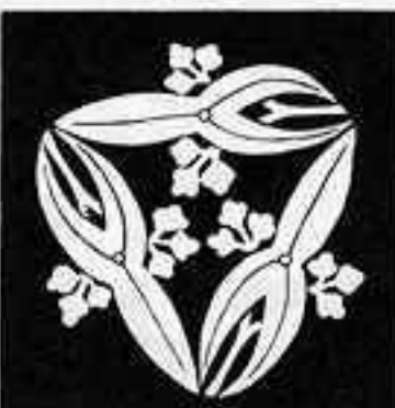
変 わ り 三 つ 追 い 沢 瀉 か わり みつおいでせきぞう