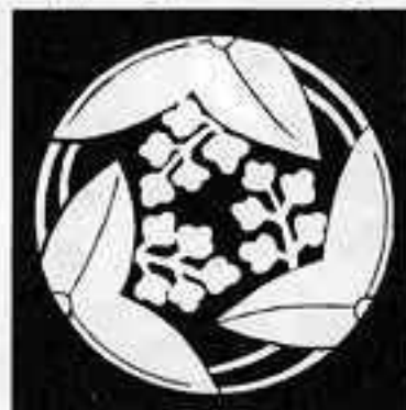
三 つ 割 り 沢 瀉 みつがわりせきぞう