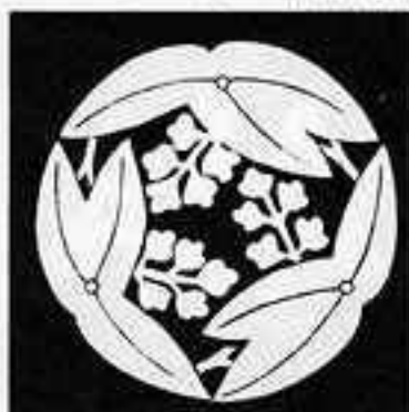
三 つ 追 い 沢 瀉 みつおいでせきぞう