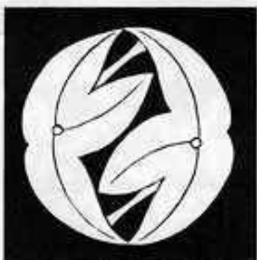
二 つ 追 い 葉 沢 瀉 ふ たつ おい え せき ぞう