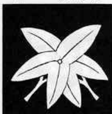
違 い 葉 沢 瀉 ちがひ え せき ぞう