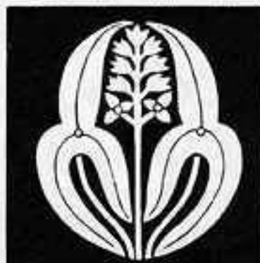
変 わ り 長 州 沢 瀉 か わり ちやうしゅうせきぞう