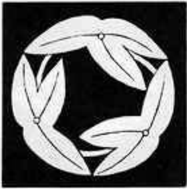
変 わ り 抱 き 沢 瀉 か わり だき せき ぞう