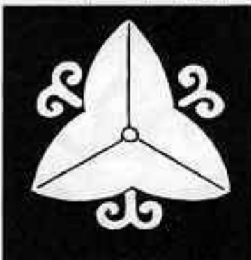
向 こ う 蔓 沢 瀉 むこう むつせきぞう