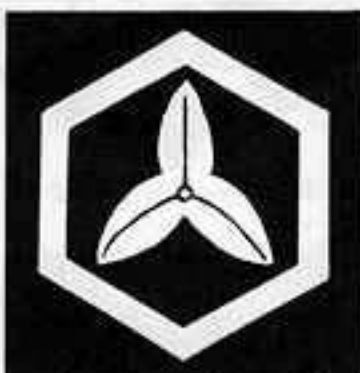
六 角 に 葉 沢 瀉 りよく かに は せき ぞう