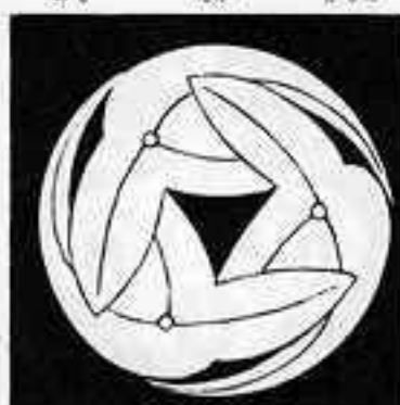
三 つ 追 い 重 ね 沢 瀉 巴 みつおいでかさねせきぞうほんま