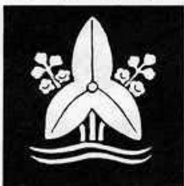
水野沢瀉 みずの おしだか