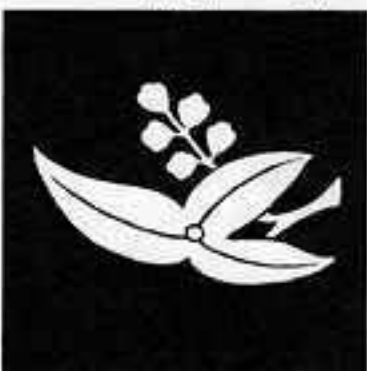
一つ花沢瀉 ひとつはな おしだか