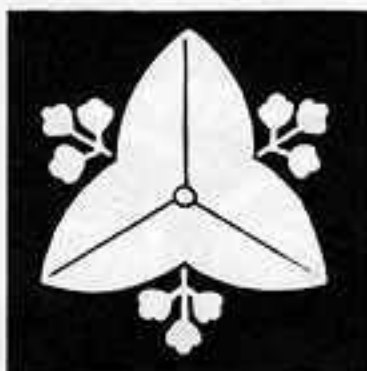
向こう花沢瀉 むこうはな おしだか