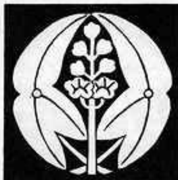
抱き沢瀉 だ おしだか