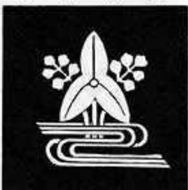
沢瀉に水 だか みず