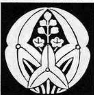
子持ち抱き沢瀉 こもち だ おしだか