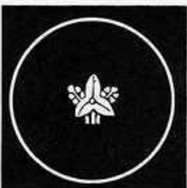
糸輪に豆立ち沢瀉 いとわ ますだ おしだか