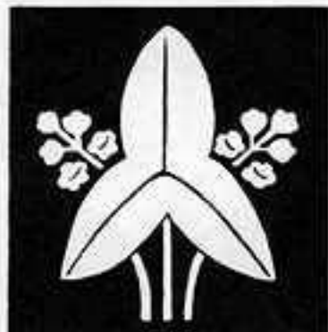
有馬立ち沢瀉 ありまた おしだか