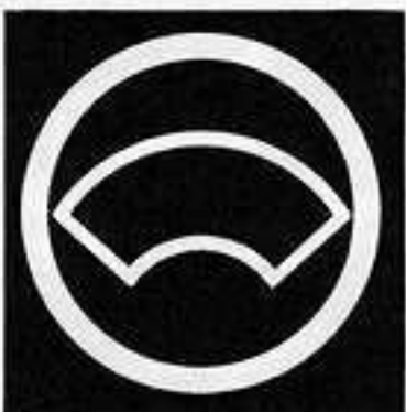
丸に陰の地紙 まる かげ じがみ