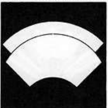
重ね地紙 かさ じがみ