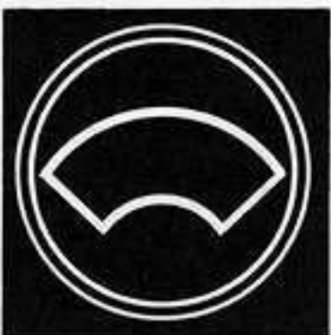
総陰丸に地紙 そうかげまる じがみ