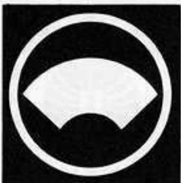
中輪に地紙 ちゅうわ じがみ