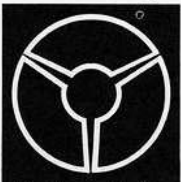
陰三つ地紙 かげ じがみ