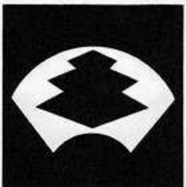
地紙に三階菱 じがみ がいびし