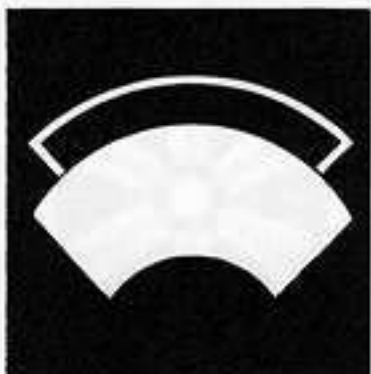
陰陽重ね地紙 いんようかさ じがみ