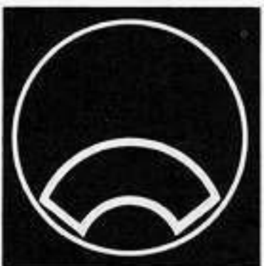
糸輪に総覗き中陰地紙 いとわ そうのぞちゅういんじがみ