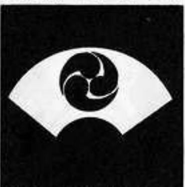
地紙に地抜き三つ巴 じがみ じめ どもん