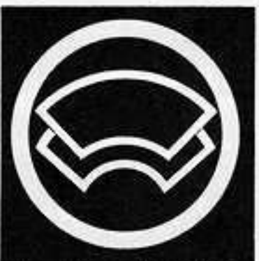
丸に陰の重ね地紙 まる かげ かさ じがみ