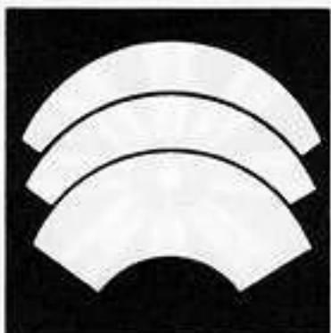
三つ重ね地紙 かさ じがみ