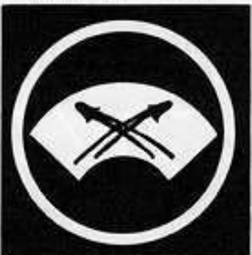
中輪地紙に地抜き違い松葉 ちゅうわじがみ じめ ちがまつば