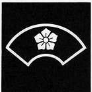
中陰地紙に桔梗 ちゅういんじがみ ききょう