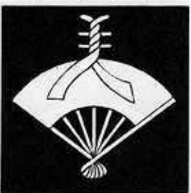
立 ち 花 家 扇 た ばな や おんぎ