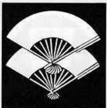
島 原 扇 しま ばら おんぎ