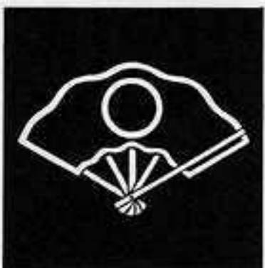
陰 源 氏 扇 かげ げん じ おんぎ