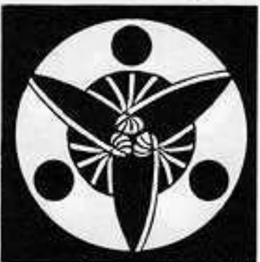
日 の 丸 三 つ 反 り 扇 ひ まる さん おんぎ