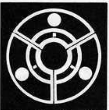
陰 渡 辺 扇 かげ わた なべ おんぎ