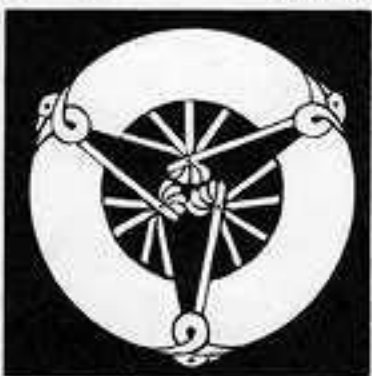
雁 金 三 つ 扇 かり かね おんぎ