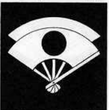
重 ね 日 の 丸 扇 かさ ひ まる おんぎ