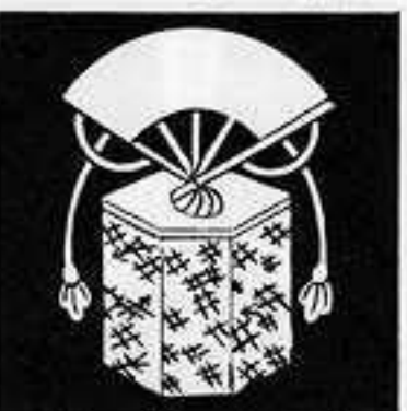
扇 落 と し おんぎ