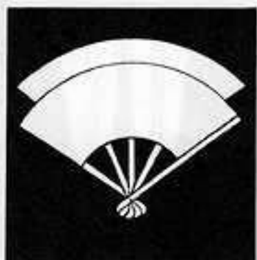
重 ね 扇 かさ おんぎ