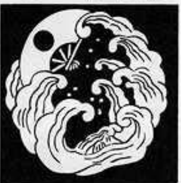
屋 島 扇 や しま おんぎ