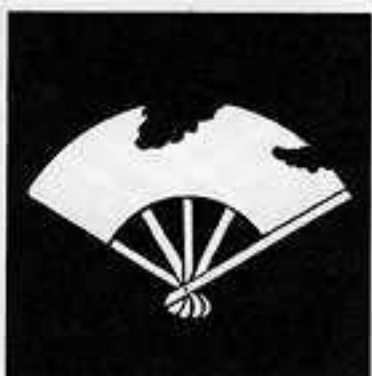
破 れ 扇 やぶ おんぎ