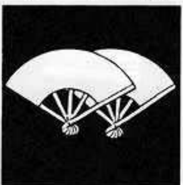
横 重 ね 扇 よこ かさ おんぎ