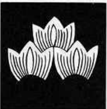
竜の鱗 りゅう ひしこ