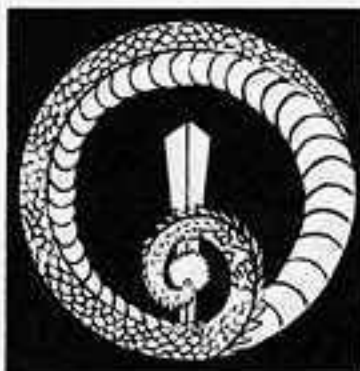
竜の剣丸 りゅう けん まる