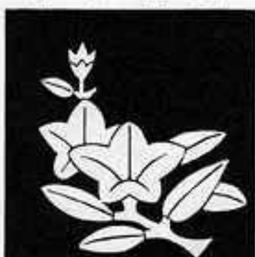
枝竜胆 えだ りゅう ぞう