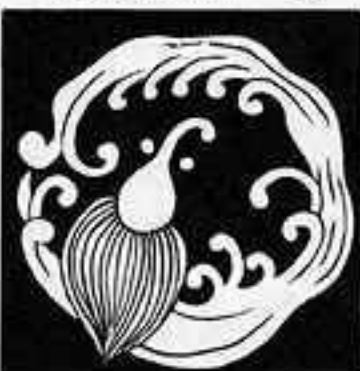
雨竜 あま りゅう