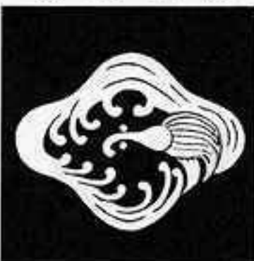
雨竜菱 あま りゅう びし