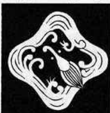
隅立て雨竜 すみ たて あま りゅう