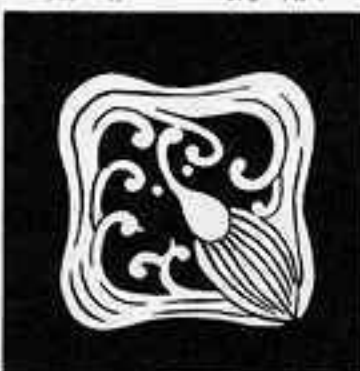
平角雨竜 ひらかく あま りゅう