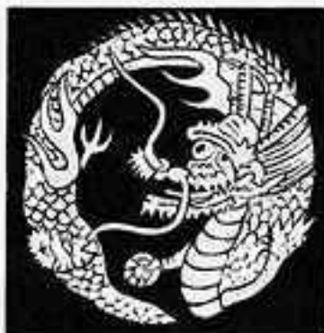
竜の丸 りゅう まる