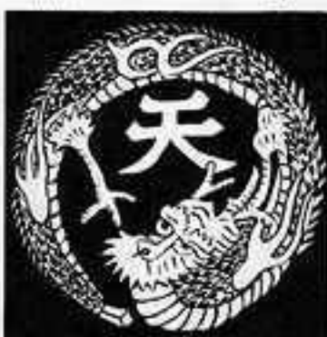
天竜の丸 てん りゅう まる