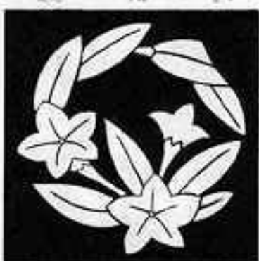
枝竜胆の丸 えだ りゅう ぞう まる