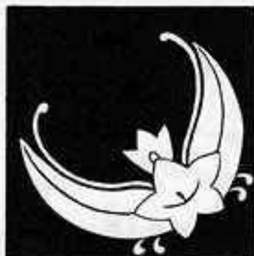
竜胆花蝶 りゅう ぞう ばな ちょう