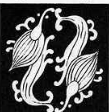
入れ違い雨竜 いれちがひ あま りゅう