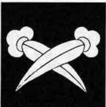
違い竜の爪 ちがひ りゅう つめ