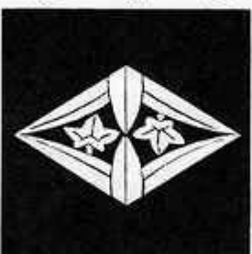
笹竜胆菱 ささ りゅう ぞう びし