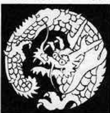
日蓮宗竜の丸 にっれんしゅう りゅう まる