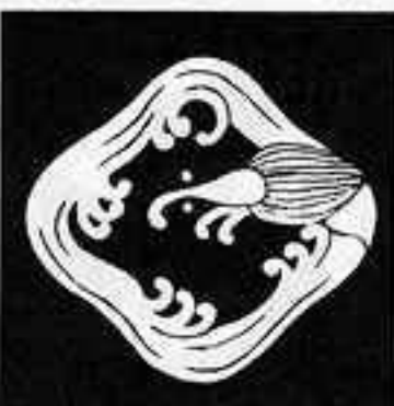
松皮雨竜 まつかわ あま りゅう