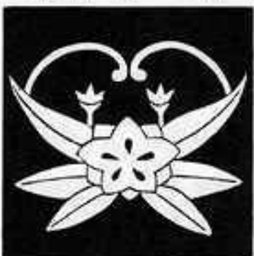
蟹竜胆 かに りゅう ぞう