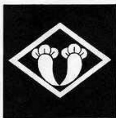
中菱に抱き丁子 ちゅうりょうに だき ちようじ