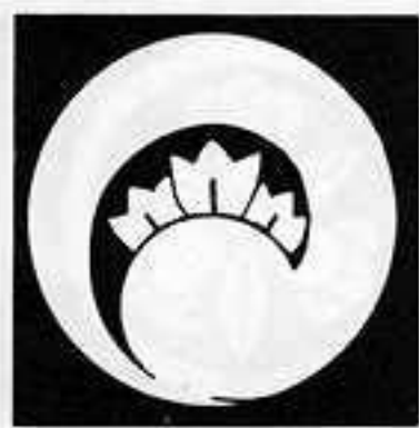
一つ鬼丁子巴 ひとつ おに ちようじ どもえ