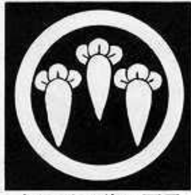
丸に三つ並び丁子 まる にさん ならび ちようじ