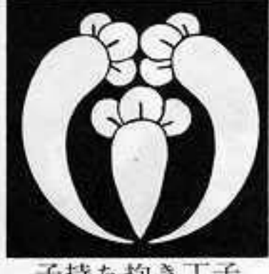
子持ち抱き丁子 こもち だき ちようじ