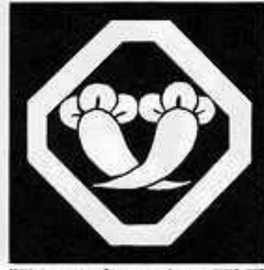
隅切り角に違い丁子 すみきりかくに ちがひ ちようじ