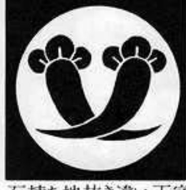
石持ち地抜き違い丁字 いしもち ぢぬき ちがひ ちようじ