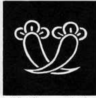
陰違い丁子 おんちがひ ちようじ