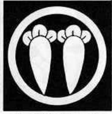
丸に並び丁子 まる にならび ちようじ