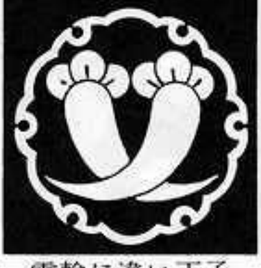
雪輪に違い丁子 ゆきわに ちがひ ちようじ