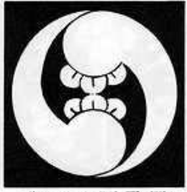
右二つ丁子巴 みぎ にふたつ ちようじ どもえ