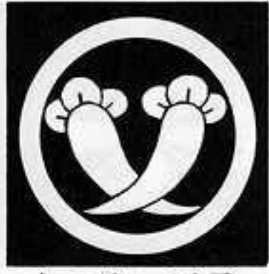
丸に違い丁子 まる にちがひ ちようじ