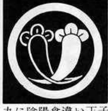
丸に陰陽食違い丁子 まる にいんようしょくちがひ ちようじ