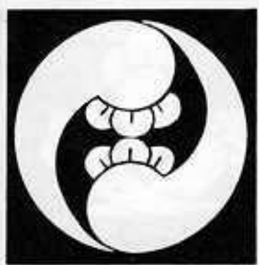
左二つ丁子巴 ひだり にふたつ ちようじ どもえ