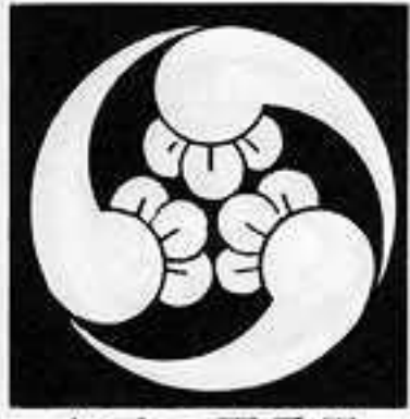
右三つ丁子巴 みぎ さん ちようじ どもえ