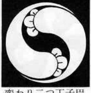
変わり二つ丁子巴 かわり にふたつ ちようじ どもえ