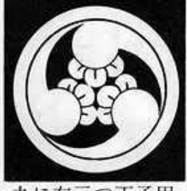
丸に右三つ丁子巴 まる にみぎ さん ちようじ どもえ