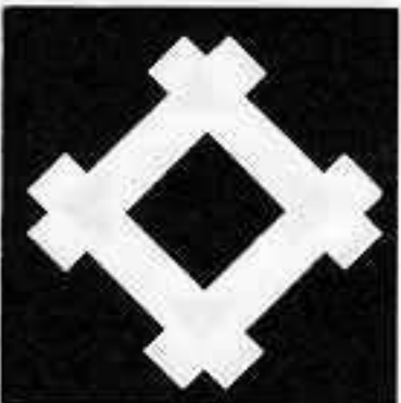
角立て井筒 かどた いづつ