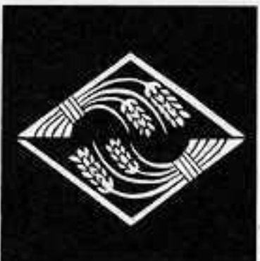
二つ追い掛け稲菱 ふたおいかけいねひし