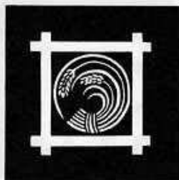
井筒に二つ穂稲の丸 いづつ にふたほいねのまる