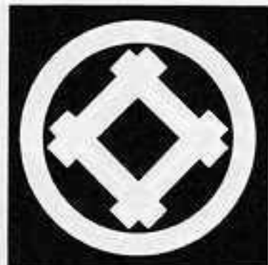
丸に角立て井筒 まる かどた いづつ