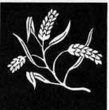
一本稲 いっぴん いね