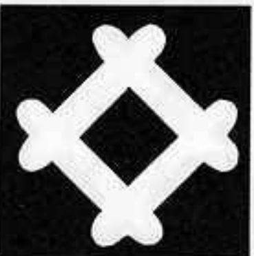
角立て撫で井筒 かどた なで いづつ