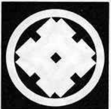
丸に角立て太井筒 まる かどた ふた いづつ