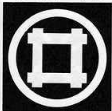
丸に平井筒 まる ひら いづつ