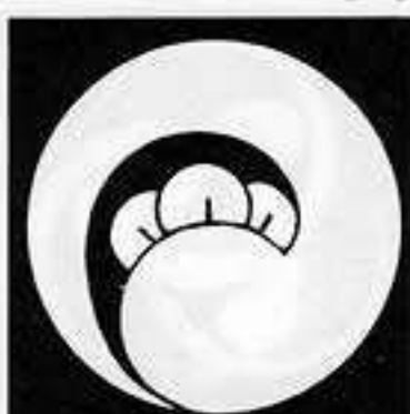
左一つ丁子巴 ひだり ひとつ ちようじ どもえ