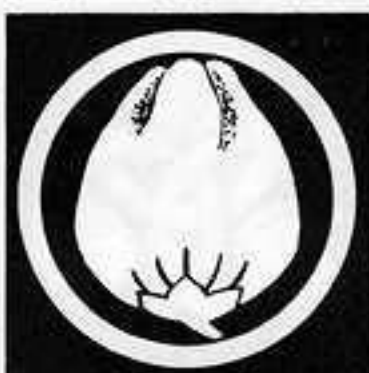
中輪に獅子唐辛 ちゅうりん ししとうがらし