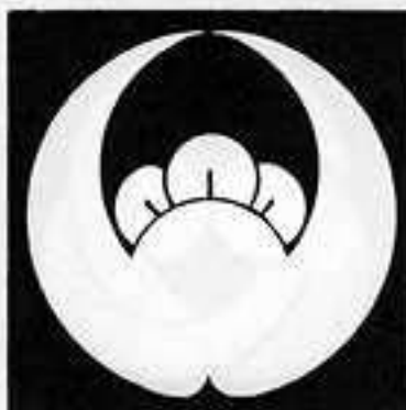
二股丁子の丸 またちようじ まる