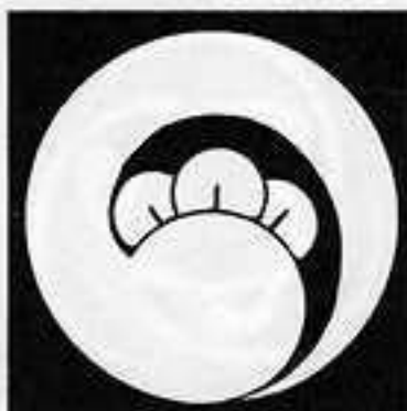
右一つ丁子巴 みぎ ひとつ ちようじ どもえ