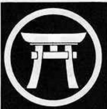
中輪に鳥居 ちゅうりん どり い