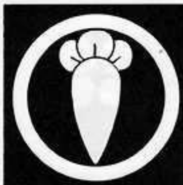
丸に一つ丁子 まる ひとつ ちようじ