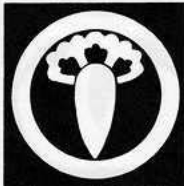
丸に花丁子 まる はな ちようじ