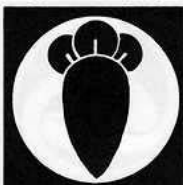
石持ち地抜き一つ丁子 いしもち じぬき ひとつ ちようじ