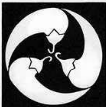
唐辛巴 とう がらし どもえ