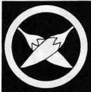
丸に遠い鷹の爪唐辛 まる ちが たか つめとうがらし