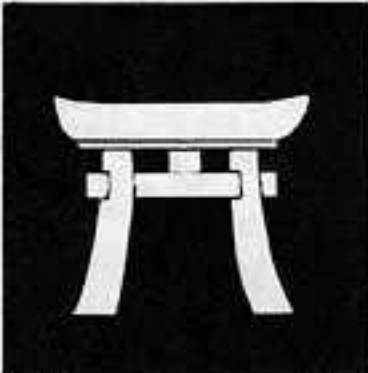
鳥居 とり い