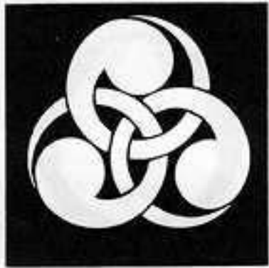
左金輪巴 ひだり かな わ どもえ