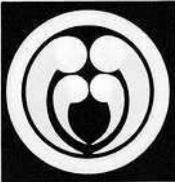
丸に子持ち抱き巴 まる こもち だかり どもえ