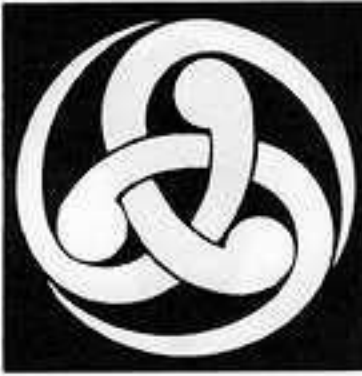
三つ組み巴 みつ くみ どもえ