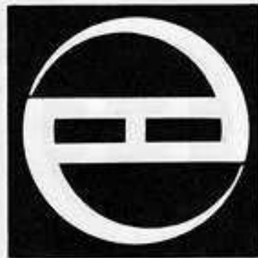
持ち合い巴の字丸 もちあい どもえ じまる