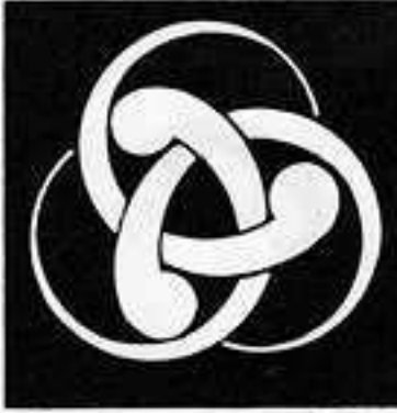
組み巴 くみ どもえ