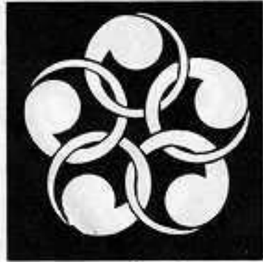
五つ金輪巴 いつつ かな わ どもえ