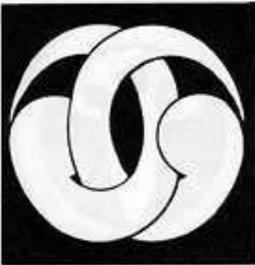
変わり組み二つ巴 か く どもえ