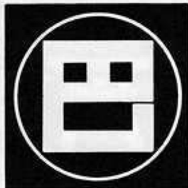
糸輪に巴の角字 いとわ どもえ かくじ