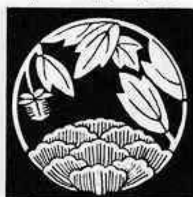
花覗き牡丹の丸 はなのぞき ぼたん まる