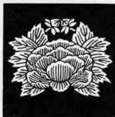
変わり蟹牡丹 か かに ぼたん