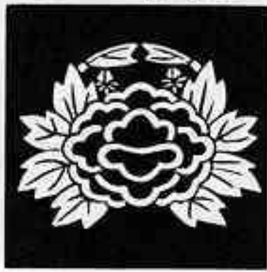
花陰蟹牡丹 はなかげ かに ぼたん