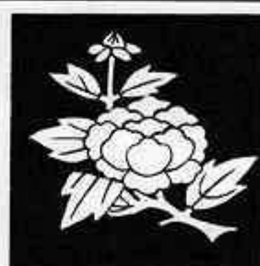
枝牡丹 えだ ぼたん