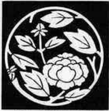
変わり牡丹枝丸 か ぼたん えだ まる