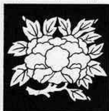
変わり枝牡丹 か えだ ぼたん