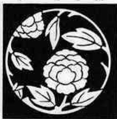
牡丹枝丸 ぼたん えだ まる