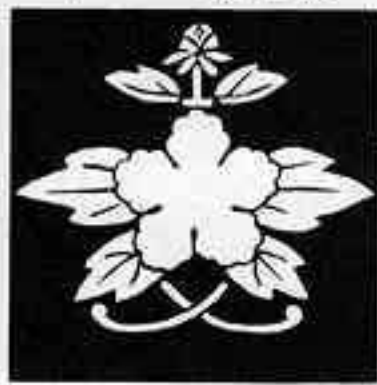
利休牡丹 りきゅう ぼたん