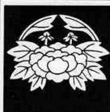
蟹牡丹 かに ぼたん