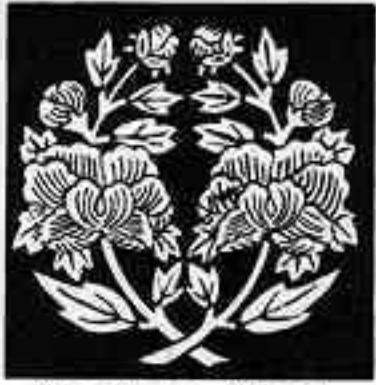
枝違い牡丹 えだ ちがひ ぼたん