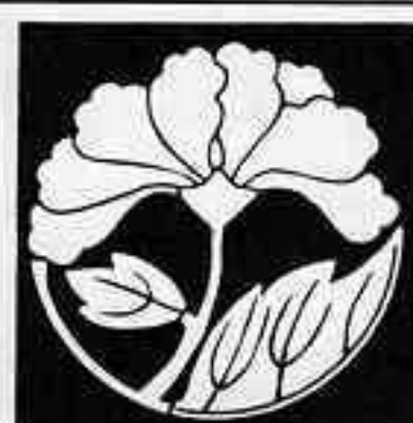
変わり乱れ牡丹 か みた ぼたん