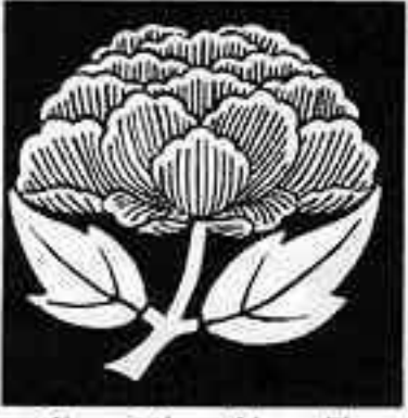
葉下牡丹 はした ぼたん