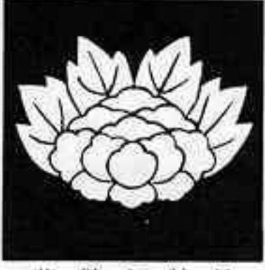
花敷き牡丹 はなしき ぼたん