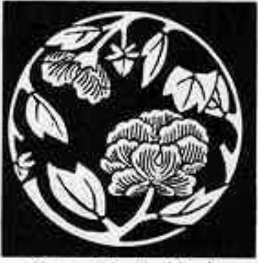
乱れ牡丹枝丸 みた ぼたん えだ まる