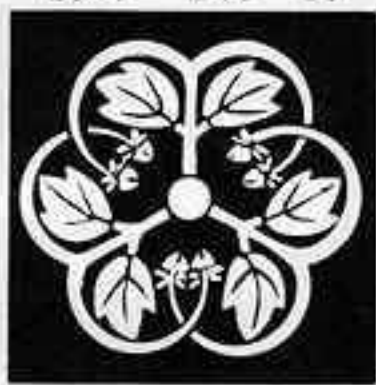
三つ蔓葉牡丹 みつづる ば ぼたん