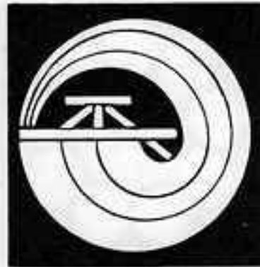
一つ帆巴 ぼ ひと