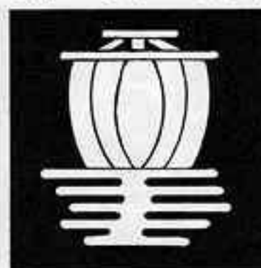
霞に帆 かすみ ぼ