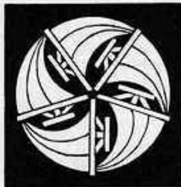
五つ帆の丸 ぼ ごと