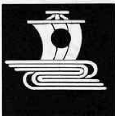
水に帆 みづ ぼ