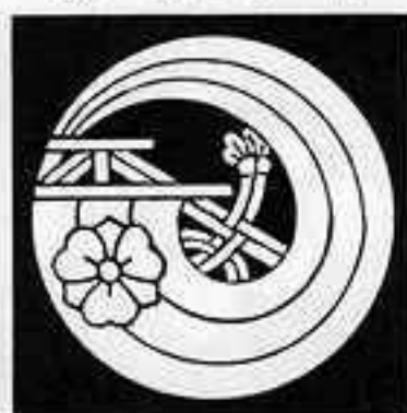
帆の丸に剣片喰 ぼの ぼ けんかたがひ