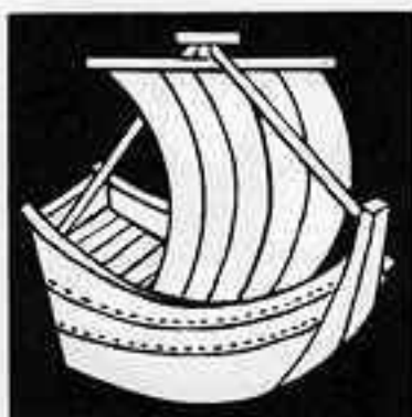
帆掛船 ぼ かけ ぶね