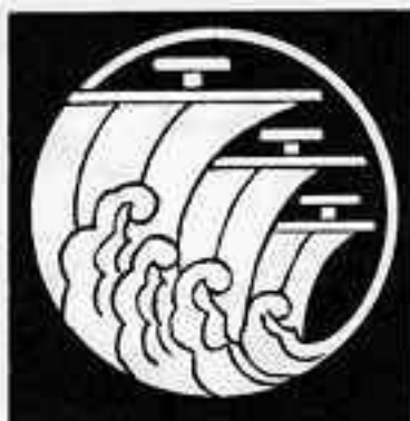
浪に三つ帆 なみ さんぼ