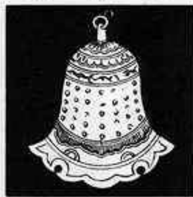
雪輪型半鐘 ゆきりんがた はん しょう