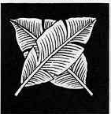
違い芭蕉 ちがひ ばしやう