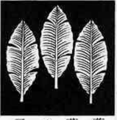
三つ芭蕉 みつ ばしやう