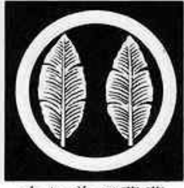
丸に並び芭蕉 まるにならび ばしやう