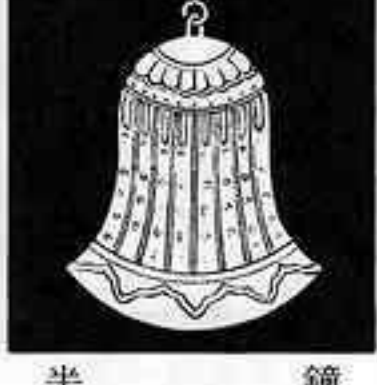
半鐘 はん しょう