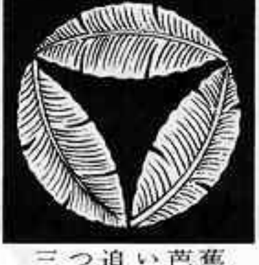
三つ追い芭蕉 みつ おい ばしやう