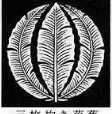
三枚抱き芭蕉 さんまい だき ばしやう