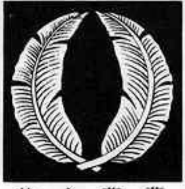
抱き芭蕉 だき ばしやう