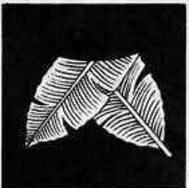
折れ芭蕉 まげ ばしやう