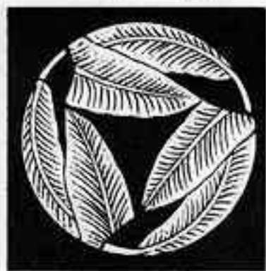
三つ折れ芭蕉 みつ折れ ばしやう