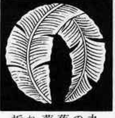
折れ芭蕉の丸 まげ ばしやう の まる