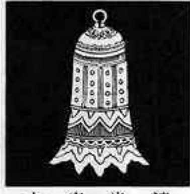
古来半鐘 こらい はん しょう