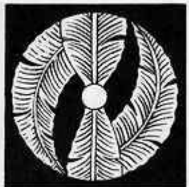
二つ折れ芭蕉巴 ふたつ折れ ばしやう ども