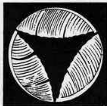
三つ割り芭蕉 みつわり ばしやう