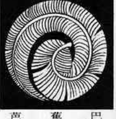
芭蕉巴 ばしやう ども