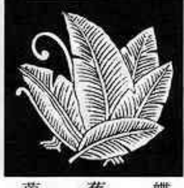
芭蕉蝶 ばしやう ちょう