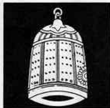
櫓半鐘 やぐら はん しょう