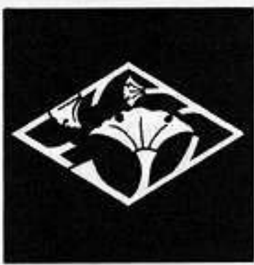
銀杏枝菱 い ぎょう えだ りん