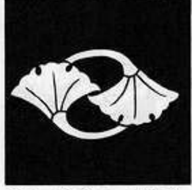
追い掛け二つ銀杏 おいかけ に ぎょう