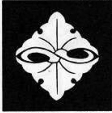
変わり二つ銀杏 か に ぎょう