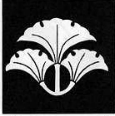
変わり三つ銀杏 か 三つ い ぎょう