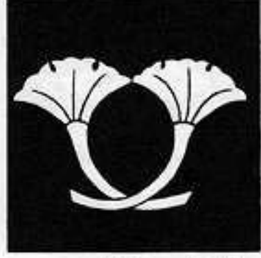
二つ軸違い銀杏 に ぎょう じくちが いちよう