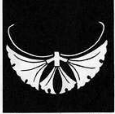
銀杏蝶 い ぎょう てつ