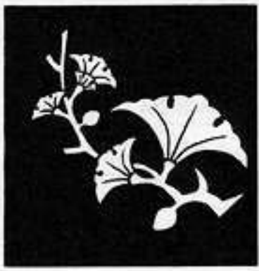
変わり枝銀杏 か えだ い ぎょう