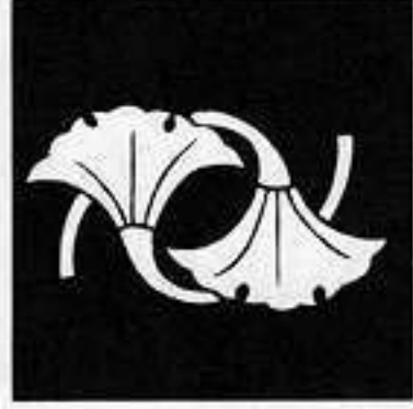
二つ違い銀杏 に ぎょう ちが