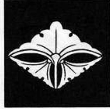
三つ銀杏菱 三つ い ぎょう りん