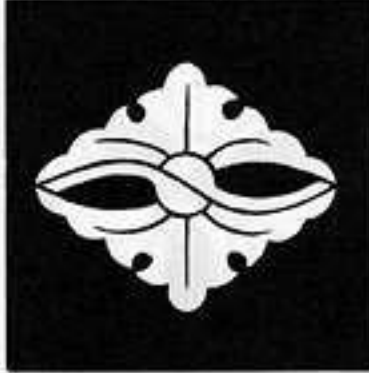
向かい銀杏菱 むかい い ぎょう りん