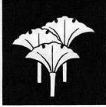
三つ立ち銀杏 三つ たち い ぎょう