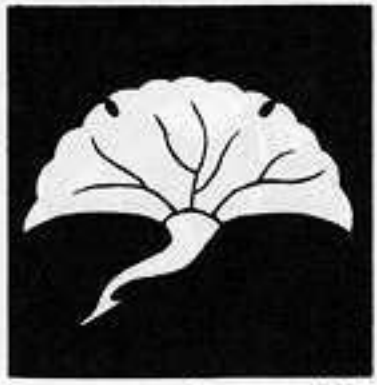
銀杏鶴 い ぎょう つる