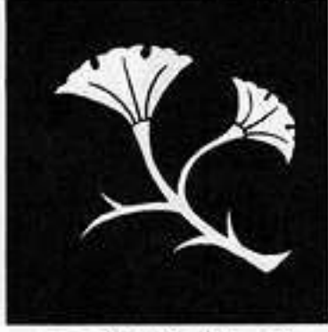
二葉枝銀杏 に ば えだ い ぎょう