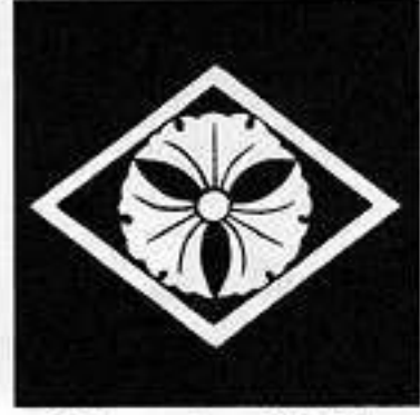
菱に三つ銀杏 りん に 三つ い ぎょう