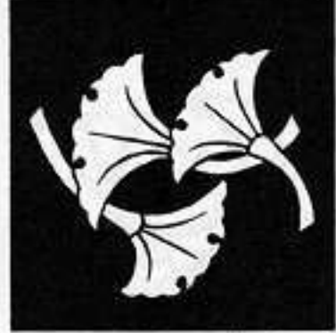
三つ落ち銀杏 み ち おち い ぎょう