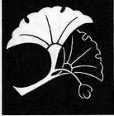
陰陽銀杏 いん よう い ぎょう